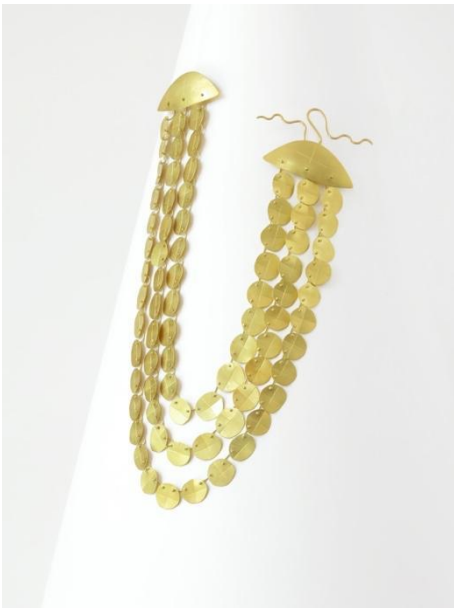
Collar. Incisions , 1993. Oro