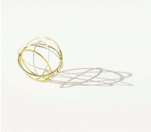
Colgante Universos , 2000. Oro y plata