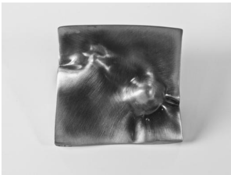
Colgante. Paisatges , 2012. Plata semioxidada