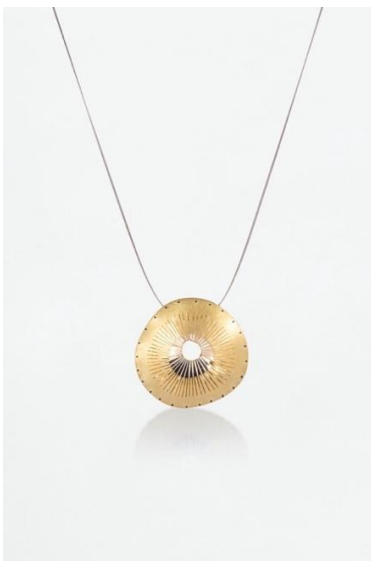
Colgante. Tesoro , 2008. Oro

El ámbito que cierra la exposición hace referencia al proceso en el que surgen los nombres que identifican a las colecciones de Majoral . Se trata de un procedimiento compartido en el que, una vez finalizada la joya, todo el equipo palpa sus estructuras y materiales, toma la temperatura, la densidad o la ligereza de sus materiales, la sopesa, la escucha, observa sus colores y texturas, sus movimientos en el espacio y su comportamiento sobre el cuerpo. De este proceso van surgiendo cada uno de los nombres que identifican a las colecciones de Majoral. Unos nombres que convocan un mapa de saberes antiguos, que emanan de saber leer las formas del viento, el movimiento de las aves, los sonidos de la materia y la reverberación de la luz. Por eso, en esta sección encontramos obras como el colgante Tesoro (2008), los collares Vida (2013), Aire (2013), Nubes (2016) y Baladre (2012) y el collar Bots (2016) y Olives (2010), entre otros.