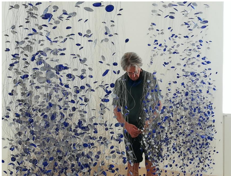
L'aiguador (detalle), 2019 – 2020). Plata y pintura acrílica

Cierra la exposición L'Aiguador (2019-2020), una escultura ingràvida que baja del techo como un planeta estrellado. Esta joya monumental se presenta como un dibujo en el espacio hecho de estructuras de plata pintada que se multiplican desde un centro abierto. L'Aiguador transmite la coexistencia de forma y luz; de movimiento y espacio; floración de metal y color.