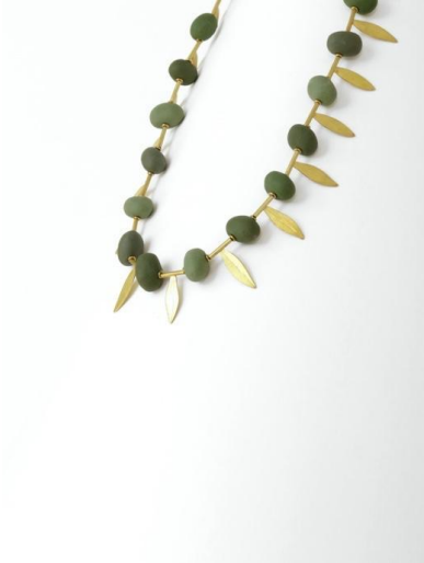
Collar. Olives , 2010. Oro y porcelana