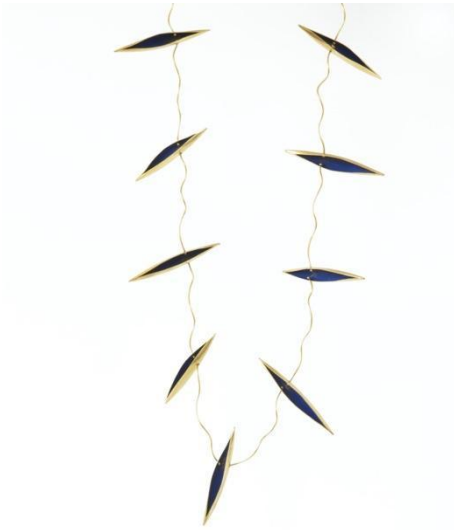
Collar. Interiors , 1997. Oro y pintura acrílica