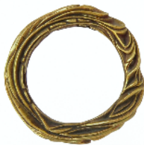
Brazalete, 1979. Bronce

El primer ámbito de la muestra está dedicado a conocer los orígenes vitales y creativos de una figura que, a partir de la curiosidad, la experimentación y las formas de hacer artesanales se convirtió en un joyero hecho a sí mismo en la cuna de la cultura mediterránea y el vínculo con el territorio. En estos inicios, los valores ancestrales y los usos sociales de la joya sustentan el trabajo de Majoral, y el oro y la plata , materiales nobles de gran sentido simbólico y espiritual, configuran sus creaciones. En este ámbito se pueden ver una serie de collares, pendientes, anillos, colgantes y brazaletes que reflejan cómo explorar la capacidad expresiva de la técnica y de la materia es una constante en el itinerario creativo de Enric Majoral. Destacan obras como el Brazalete de bronce (1979), el broche y collar Sargantanes (1983), los pendientes Drac (1992), el collar y anillo Rocs (1990) y el collar Incisions (1993).