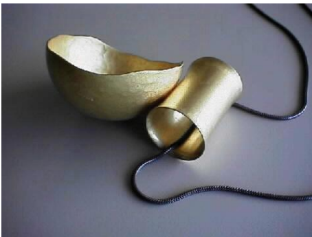
Colgante. Cuconet , 1998. Oro