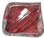
Colgante. Joies de sorra , 2006. Plata y pintura acrílica