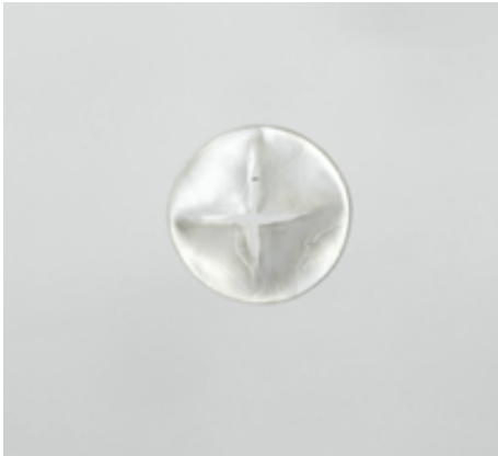
Colgante. Escuts , 2011. Plata

2012), que incluye colgantes, broches y anillos, los colgantes Paisajes (2012), y los colgantes de plata oxidada que incorporan pintura. Estas obras dan forma a la vida en movimiento a través del gesto y materializan la capacidad del vacío para dar forma al espacio. Hablamos de piezas en las que el embate directo del artista genera un espacio siempre diferente en la materia y cómo el color ilumina su calidad física.