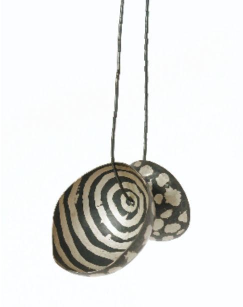
Colgante Batik , 2006. Plata y técnica batik