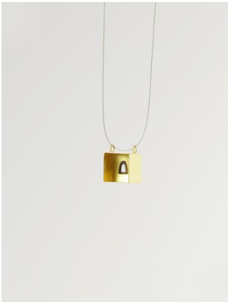
Colgante. Capelleta , 1996. Oro y pintura acrílica