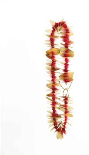
Collar. Moher , 2003. Oro y lana moher