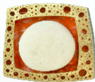
Colgante de plata, oro y pintura y bola de coral blanco, 2000. Plata, oro, pintura y coral blanco