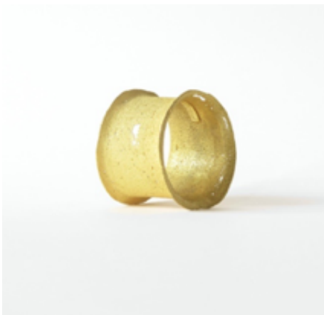
Brazaletes. Joies de sorra , 2007. Oro