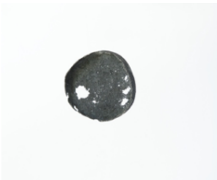
Broche. Joiies de sorra , 2007. Plata pavonada

Las Joyas de arena surgen del uso innovador del poliuretano , muy popular entre los escultores y con una textura de gran riqueza. Este material se activa con la posterior aplicación del pigmento que, en diálogo con los procesos de oxidación propios de la plata, desencadena una gama de colores y metamorfosis del material impensables. En lugar de crear una joya, Enric Majoral la esculpe, la pinta y deja que el azar la transforme. Estas obras demuestran cómo, más interesado en el funcionamiento de los materiales que en la simple técnica, Majoral llega a la madurez del oficio abandonando todo método y entregado a la belleza de la improvisación y la imperfección . Encontramos colgantes (2006), broches (2007), brazaletes (2006 y 2007) y anillos (2006). Todas las piezas combinan plata, oro y pintura.