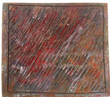
Colgante, 2008. Plata oxidada, textura y pintura