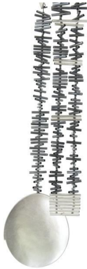
Collar. Eivissa , 2010. Plata