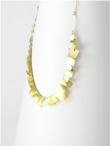
Collar. Aire , 2013. Oro