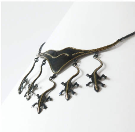
Collar. Sargantanes , 1983. Plata y oro