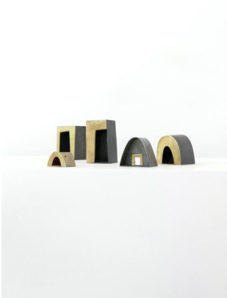
Colgantes. Capelletes , 1996 – 1997. Plata y oro