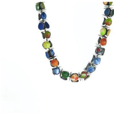
Collar. Cuconets , 2006. Plata y pintura acrílica