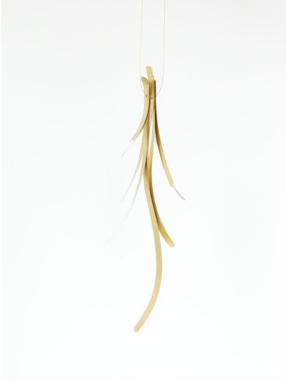
Colgante. Posidònia , 2019. Oro