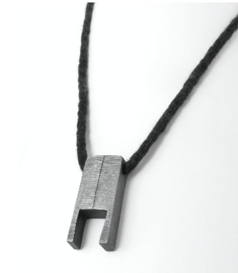
Colgante Blocs , 2012. Plata y lana mohair