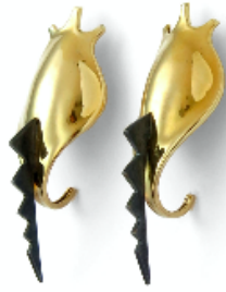
Pendientes. Drac , 1992. Plata y oro