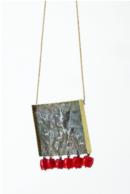
Colgante Àfrica , 2001. Plata, oro y coral