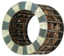
Brazalete de plata. Mar de Formentera, (Gabietes) 1998. Plata y posidonias naturales

y modos de hacer de la alta joyería en su sentido tradicional, y demuestra cómo la elocuencia muda de la pintura no silencia la densidad y la energía del metal oculto. Otras obras de este ámbito son los colgantes Universos (2000), el collar Agua (2002) y el colgante Nius (2008).