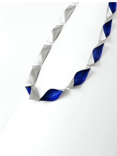
Collar. Bots , 2016. Plata y pintura acrílica