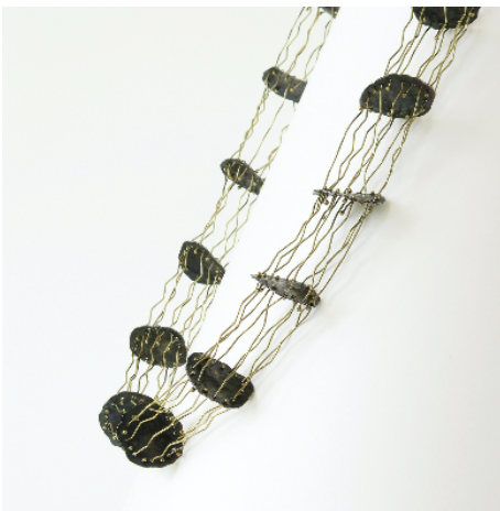
Collar Agua , 2002. Plata y oro