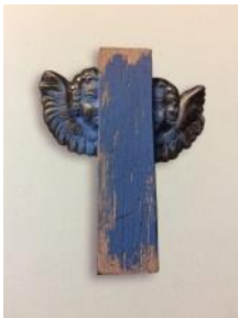
Broche , 2011. Colección “ Condición angélica ” Plata, madera y pintura acrílica