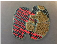
Broche , 1984. Colección "Cielo" Plata, oro y pintura acrílica