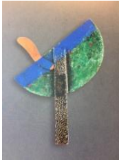
Broche , 1987-1988. Colección "Suite Praga" Plata, cobre y pintura acrílica Colección Museo del Diseño de Barcelona

Colección "Suite Praga": inspirada en los tejados de cobre