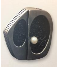
Broche, 1969 Plata, cerámica y perla Colección Museo del Diseño de Barcelona