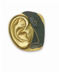
Colgante , 2016. Oro y pintura acrílica