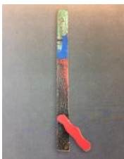
Broche , 1987-1988. Colección "Suite Praga" Plata, cobre y pintura acrílica Colección Museo del Diseño de Barcelona