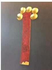
Broche , 1997. Colección "Los árboles de la memoria" Oro y laca urushi