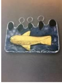
Colgante , 2000 Colección “ Reencontrar el futuro ” Plata, oro y cantos rodados

“Caminos interiores”: árboles de la vida