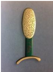
Broche , 1997. Colección "Los árboles de la memoria" Oro y laca urushi Colección Museo del Diseño de Barcelona