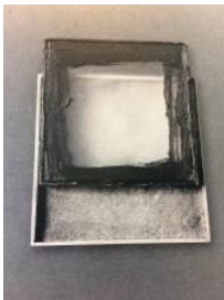
Broche, 1970. Colección "44 variaciones sobre una forma seriada" Plata, cristal y pintura acrílica

Geometrización, experimentación y seriación