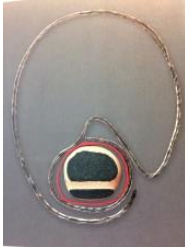
Collar, 1963 Plata, plástico y cerámica Colección Museo del Diseño de Barcelona