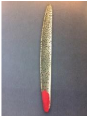
Broche , 1991-1993. Colección "Bipolaridades" Plata, oro, laca urushi y pintura acrílica