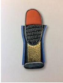
Broche , 2009. Colección “ Caminos interiores ” Plata, oro, laca urushi y pintura acrílica