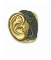
Penjoll , 2016 Or i pintura acrílica

Imatges en alta disponibles per premsa a: