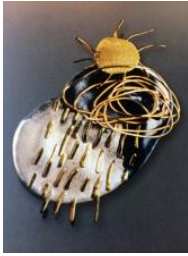
Fermall , 1994 Col·lecció "Cel" Plata i or