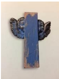
Fermall , 2011 Col·lecció "Condició angèlica" Plata, fusta i pintura acrílica