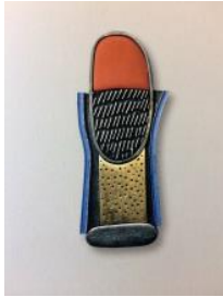
Fermall , 2009 Col·lecció "Camins interiors" Plata, or, laca urushi i pintura acrílica