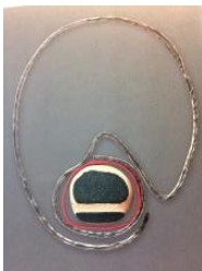
Collar, 1963 Plata, plàstic i ceràmica

Als anys seixanta ja inicia una línia pròpia, combinant la plata amb altres materials fins aleshores molt poc corrents.