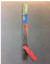
Fermall , 1987-1988 Col·lecció " Suite Praga " Plata, coure i pintura acrílica Col·lecció Museu del Disseny de Barcelona