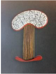
Fermall , 1997. Col·lecció "Els arbres de la memòria" Or, laca urushi i closca d'ou