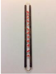
Collar , 1968-1970 Or, ferro, pintura acrílica i cuir Col·lecció Museu del Disseny de Barcelona