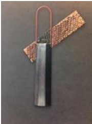
Fermall , 1987 Or, plata i pintura acrílica