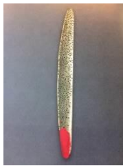
Fermall, 1991-1993 Col·lecció "Bipolaritats" Plata, or, laca urushi i pintura acrílica