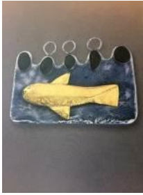
Penjoll , 2000 Col·lecció "Retrobar el futur" Plata, or i pedres de riu