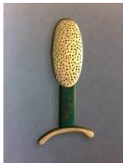
Fermall, 1997 Col·lecció "Els arbres de la memòria" Or i laca urushi Col·lecció Museu del Disseny de Barcelona