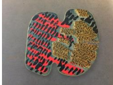
Fermall , 1984 Col·lecció " Cel " Plata , or i pintura acrílica