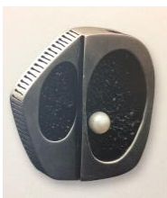
Fermall, 1969 Plata, ceràmica i perla