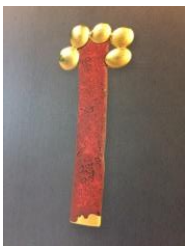
Fermall, 1997 Col·lecció "Els arbres de la memòria" Or i laca urushi