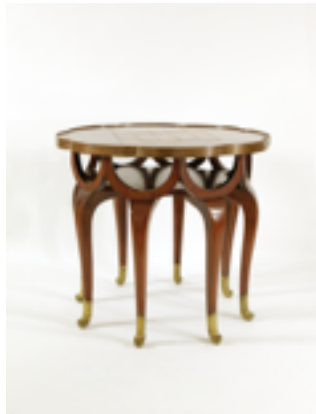
Taula c1900 Utilitzada per Adolf Loos / F.O.Schmidt Col·lecció Hummel, Viena.