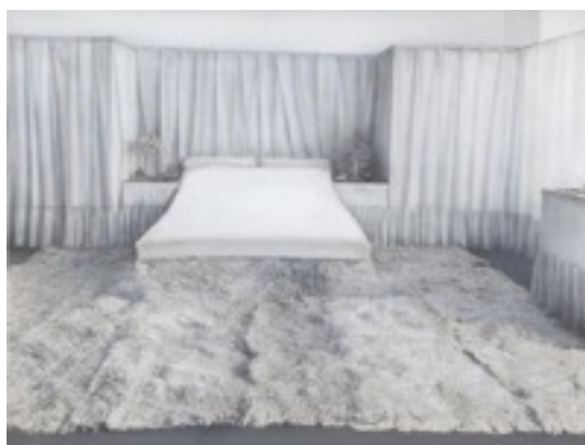
Habitació Lina Loos The Albertina Museum, Vienna