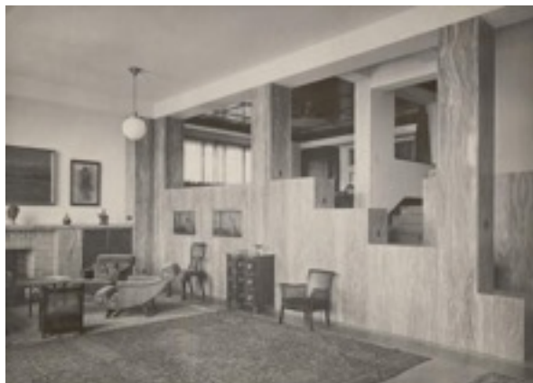
Interior Casa Müller The Albertina Museum, Vienna