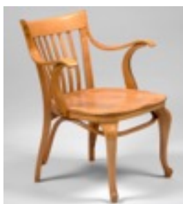
Cadira de braços del Cafè Capua, 1913 Adolf Loos Col·lecció Hummel, Viena.