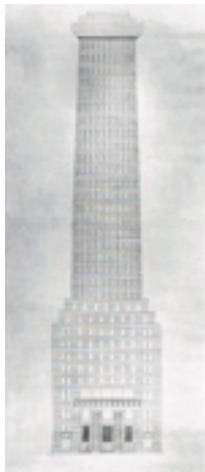
Dibuix del Chicago Tribune Column, 1922 Adolf Loos The Albertina Museum, Vienna

En aquesta àrea es podran veure esbossos i maquetes de projectes inèdits que mai no es van acabar de realitzar, com l'esmentada anteriorment del Chicago Tribune Column o la casa de la cantant Josephine Baker (1927) a París, en què l'espai interior buit és una gran piscina i el revestiment de l'exterior en marbre blanc i negre segueix la tradició clàssica florentina.