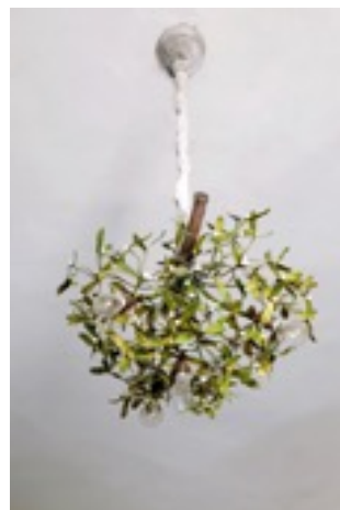
Llum de sostre de la vivenda Turnowsky, 1900 Utilitzada per Adolf Loos Col·lecció J Hummel