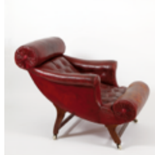
Butaca, 1907 Utilitzada per Adolf Loos / F.O.Schmidt Col·lecció Hummel, Viena.