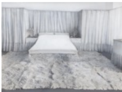
Habitació Lina Loos The Albertina Museum, Vienna