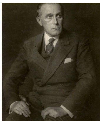
Fotografia d'Adolf Loos The Albertina Museum, Viena. Foto: Gisela Erlacher