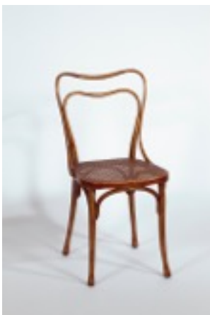
Cadira de fusta corbada, 1899 Adolf Loos, Col·lecció Hummel, Viena.