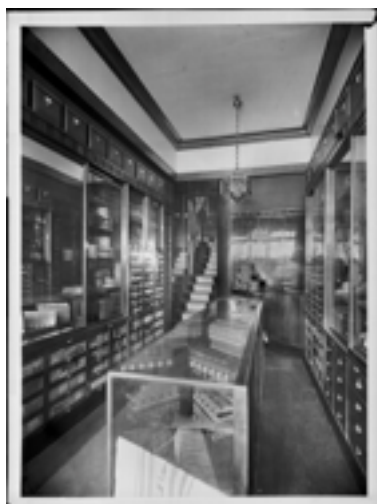
Interior de la planta baixa de la botiga Knize, 1910/1913

També s'hi podrà veure una maqueta de la Casa Steiner (1910), la qual representa la filosofia Loos, amb una façana austera i que és el resultat del seu interior i amb finestres que no ho són pròpiament, sinó espais de llum que serveixen per a il·luminar els interiors.