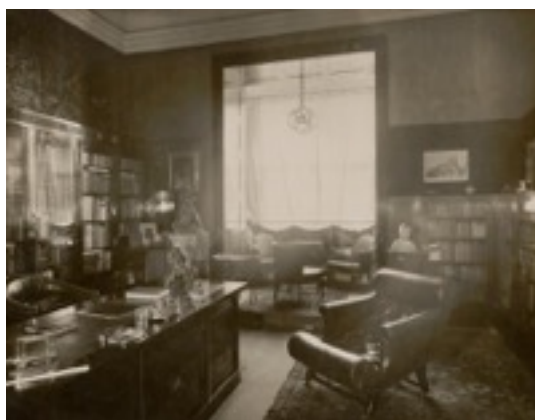
Despatx Casa Friedman The Albertina Museum, Vienna