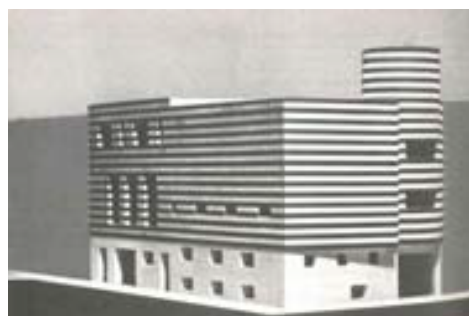
Maqueta de paper de la casa de Josephine Baker, 1927 Adolf Loos CCCB, Barcelona