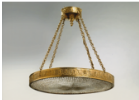
Làmpada de sostre, 1907 Adolf Loos Col·lecció Hummel, Viena.