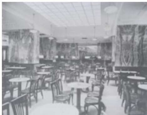
Interior Cafè Kapua The Albertina Museum, Vienna