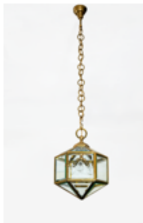
Làmpada de sostre 1905-1913 Adolf Loos Col·lecció Hummel, Viena.