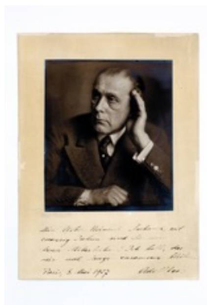
Retrat Adolf Loos, 1927