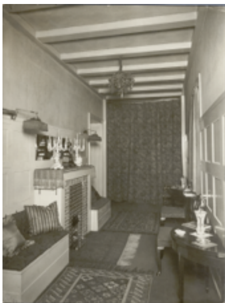
Casa Turnowsky Adolf Loos The Albertina Museum, Vienna

A la Casa Turnowsky, Loos dissenya nous mobles en blanc d'aire minimalista, amb sanefes estriades de cornisa clàssica, que tant aplica a armaris com a marcs de mirall que també es podran veure a la mostra.