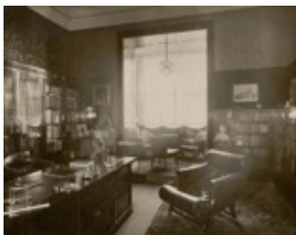
Despatx Casa Friedman The Albertina Museum, Vienna

Aquesta aproximació entre arquitectura i gènere i les seves diferències es poden veure en el contrast entre un despatx d'oficina i alguns dels mobles que hi haurà a la mostra, com escriptoris, butaques o llibreries, normalment fets de fustes més fosques, en contraposició amb els mobles d'entorn per a la dona, com tocadors, normalment de colors més suaus, o amb el revestiment sensual del dormitori de Lina Loos, la seva primera muller, la qual es podrà reviuire a través d'una gran fotografia que la reproduceix.