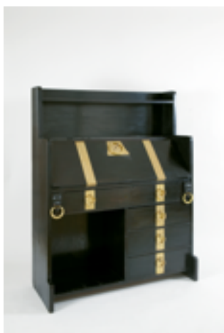
Escriptori 1898/1899 Adolf Loos Col·lecció J Hummel