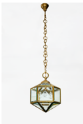
Làmpada de sostre, 1905-1913 Adolf Loos Col·lecció Hummel, Viena.