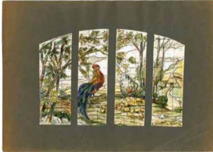
Proyecto de vitral para la casa de la calle Iradier, 35 de Barcelona