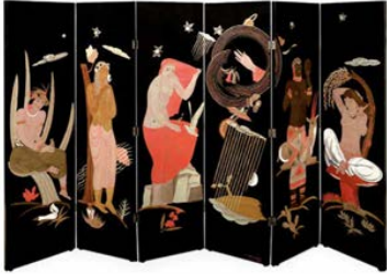
Biombo La Creación

contexto en el que convivían tradición, modernidad y vanguardia, mientras Gaudí era defendido por Dalí y los surrealistas.