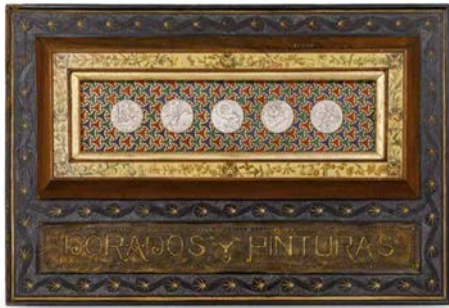
Panel publicitario Brosa. Dorados y Pintura