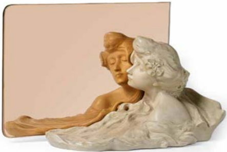
Cabeza de mujer con espejo

En definitiva, piezas emblemáticas de Gaudí, Jujol y otros se equiparan a los “grandes clásicos” del diseño internacional, concepto que es a la par un argumento de venta y de distinción cultural, que acerca el valor del diseño al de una obra de arte.