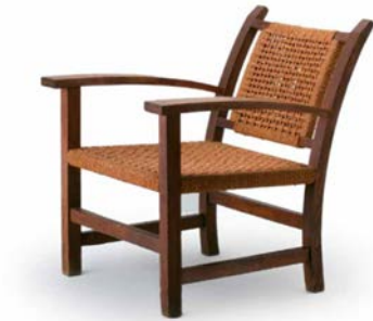
Butaca Modelo GATCPAC

Con el convencimiento de que la máxima belleza era fruto de la máxima sencillez, como defendía el crítico Rafael Benet, la tradicional, popular y anónima silla de enea, recuperada por los noucentistes, muy alejada de los historicismos, ponía en valor el arte popular como fundamento de la modernidad. El racionalismo y la vanguardia de los años treinta, con una mirada más abierta, contribuyeron a la introducción del espíritu mediterráneo en el diseño, como demuestran el mobiliario y el interiorismo del GATCPAC. La butaca destinada al pabellón de la República de la Exposición Internacional de 1937, en París, se ha convertido en su mejor icono.