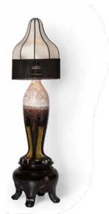
Lámpara de pie