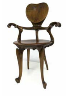
Silla de despacho del Sr. Calvet

Barcelona, c. 1904. Edición del 2005 Madera de roble tallada MADB.136.986