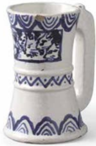
Jarra de los Quatre Gats