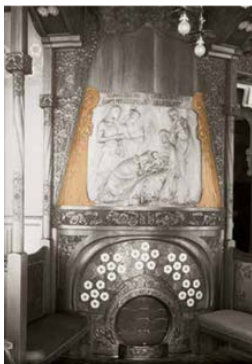
Hogar presidido por la Adoración de los Reyes Magos, con los ángeles a ambos lados, 1905

Proviene de la Casa Lleó Morera, Barcelona MADB 71.792-71.793