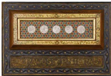
Panel publicitario Brossa. Dorados y Pintura