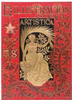
Cubierta de revista La Ilustración Artística