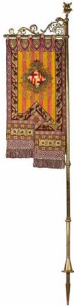
Estandarte Orfeo Barcelonès