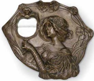
Espejo La belleza