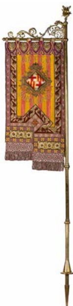
Estandarte Orfeó Barcelonès

El ajuar doméstico estaba lleno de encajes hechos a mano —“legítimos”, los llamaban—, labores femeninas con bolillos o con aguja, hasta la llegada del encaje mecánico de gran difusión en el que Cataluña también destacó. El encaje de bolillos fomentó una red de encajeras, que trabajaban en sus domicilios, y de comerciantes de encajes, que distribuían los encargos. Las exposiciones, como la celebrada en Arenys de Munt en 1906, fueron buen escaparate de esta labor.