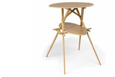
Mesa Jujol 1920

Barcelona, 1900-1901. Edición del 2020 Madera de roble tallada y torneada, hierro forjado Donación BD Barcelona Design, 2020 MDB 12.542