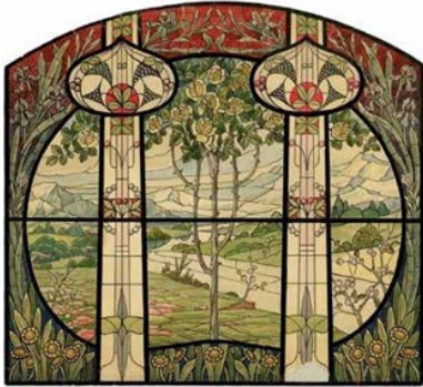
Proyecto de vitral

Frederic Vidal Puig aprendió en Londres hacia 1899. Diminutas piezas esféricas de vidrio de colores dispuestas en unos alveolos delimitados por finas paredes de metal y todo ello sellado por dos placas de vidrio; se aplicaban en puertas, muebles, etc.