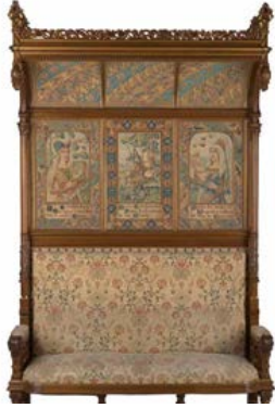
Escaño de san Jorge