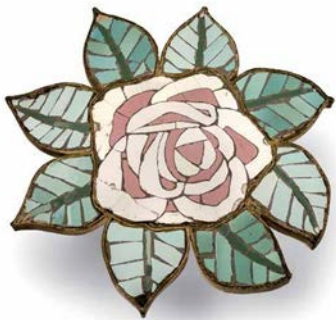
Ornamento arquitectónico del Palau de la Música

Las industrias artísticas tuvieron un desarrollo espectacular. Se puede hablar de formas mixtas de fabricación con productos industriales acabados de forma manual o productos artesanales distribuidos por un sistema comercial moderno. Como consecuencia, tiene lugar una valoración de los productos estandarizados sin detrimento de la consideración que tiene la pieza única.