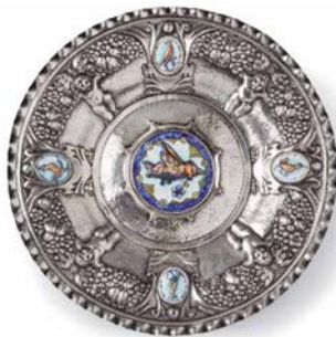
Plat del ocells