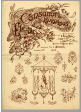
El Consultor de los Bordados, núm. 20