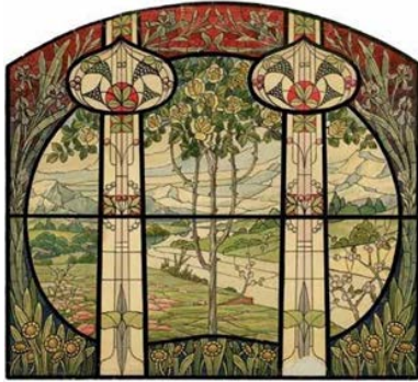
Proyecto de vitral