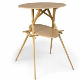
Mesa Jujol 1920

Josep Maria Jujol i Gibert (1879-1949) Mobles 114 , a partir de 2019, productor