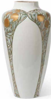
Jarrón de los naranjos