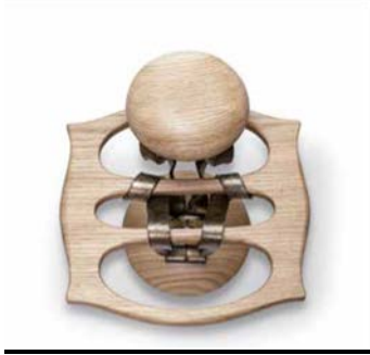
Colgador de la Casa Calvet. Colección BD Art Editions

Antoni Gaudí i Cornet Taller Casas i Bardés, Barcelona, 1900-1901, productor BD Barcelona Design, a partir de 2019, productor