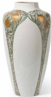
Jarrón de los naranjos

Cerámica de arte, fundición artística o bronce de salón, orfebrería y joyas de arte, de una altísima calidad material y técnica, obra de artesanos que recuperaron y destacaron en los antiguos procedimientos y aportaron nuevos ensayos derivados de la industria, están presentes por doquier. Es el inicio de un camino que nos llevará a reconocer el esplendor de las artes decorativas en Cataluña desde el modernisme hasta el art déco.