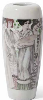
Jarrón de las musas

Proviene de la Exposición de Bellas Artes e Industrias Artísticas, Barcelona 1907 MCB1.576