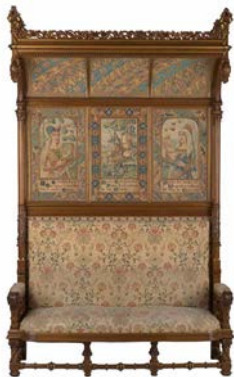
Escaño de san Jorge