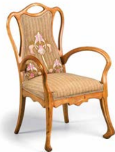
Silla de brazos

Los arquitectos e industriales más comprometidos hicieron de este estilo una interpretación más original y moderna, pero desde la tradición. La voluntad de hacer convivir esta paradoja, entre el arraigo a la tradición y el cosmopolitismo Art Nouveau, es lo que confiere a la arquitectura y a las artes decorativas catalanas del modernisme tan altas cotas de originalidad.