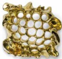
Mirilla y tirador de las puertas de la Casa Calvet. Colección BD Art Editions