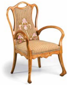
Silla de brazos