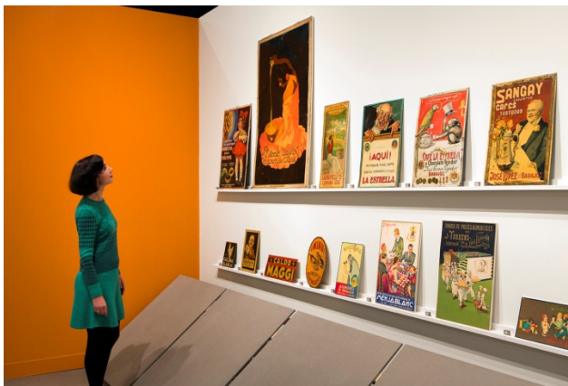
Sala de exposiciones “El ‘boom’ de la publicidad. Reclamos de hojalata, cartón y azulejo. 1890-1950”

14 de diciembre de 2018 - 31 de marzo de 2019