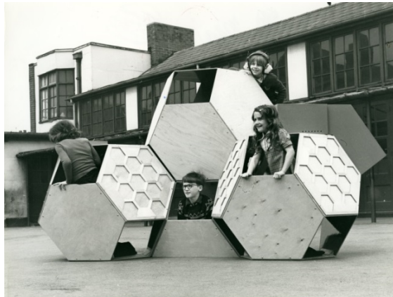
Victor J. Papanek Tetraikadecahedral, estructura de juego móvil. 1973-1975

Con la exposición “Victor Papanek: la política del diseño” , del 31 de octubre de 2019 al 2 de febrero de 2020 , el Museo del Diseño presentará la primera gran retrospectiva centrada en el diseñador, autor y activista Victor J. Papanek (1923-1998). La exposición pretende redescubrir a Papanek como uno de los pioneros más influyentes del siglo XX del enfoque de un diseño social y ecológico que empezó en los años sesenta planteando la inclusión, la justicia social y la sostenibilidad, unos temas de una gran relevancia para el diseño actual.