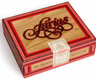
Ricardo Rousselot (logotip) Capsa de puros Farias c. 1984 Donació Ricardo Rousselot, 2018