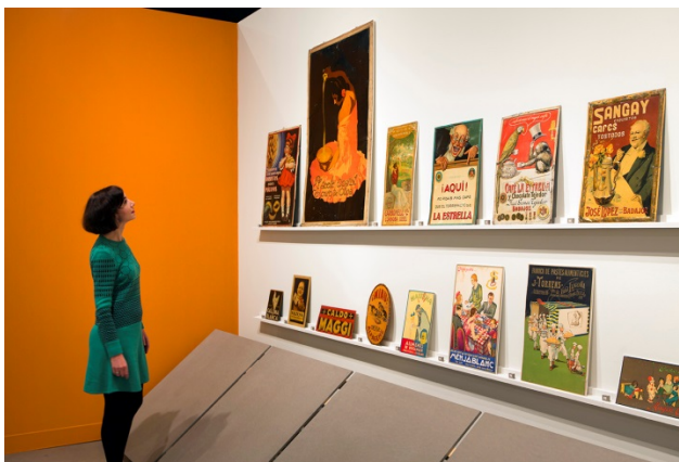
Sala d'exposicions El boom de la publicitat. Reclams de llauna, cartró i rajola. 1890-1950

14 de desembre de 2018 - 31 de març de 2019