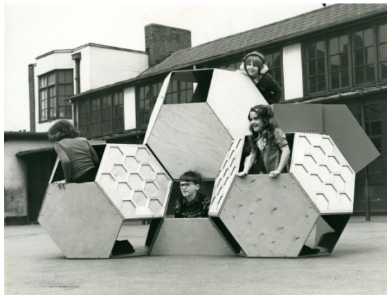
Victor J. Papanek Tetraikaidcahedron, estructura de joc mòbil. 1973-1975

Amb l'exposició Victor Papanek: la política del disseny, del 31 d'octubre de 2019 al 2 de febrer de 2020 , el Museu del Disseny presentarà la primera gran retrospectiva centrada en el dissenyador, autor i activista Victor J. Papanek (1923-1998). L'exposició pretén redescobrir Papanek com un dels pioners més influents del segle XX de l'enfocament d'un disseny social i ecològic que va començar els anys seixanta plantejant la inclusió, la justícia social i la sostenibilitat, uns temes d'una gran rellevància per al disseny actual.