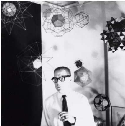
Victor J. Papanek a Buffalo, NY, Abril 1959

31 d'octubre de 2019 -2 de febrer de 2020