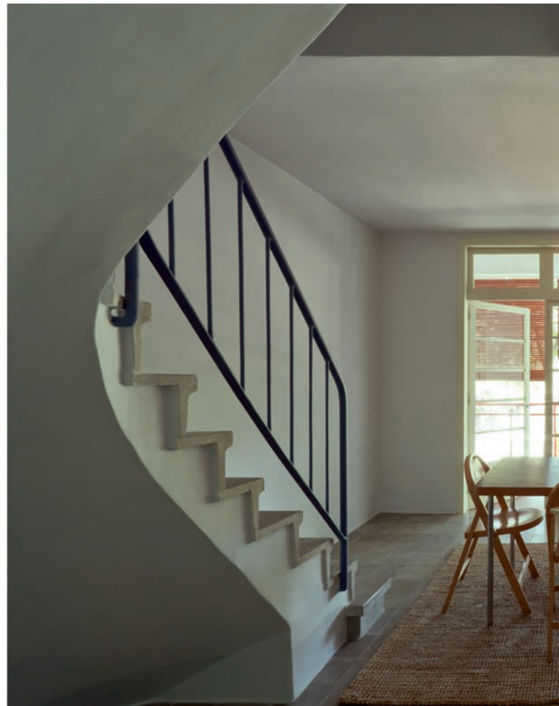
La sala-menjador amb el mobiliari que l'ambienta: taula de Marcel Breuer, cadires Thonet, bufet segons disseny del GATCPAC i globus amb tub d'alumini dels anys trenta.