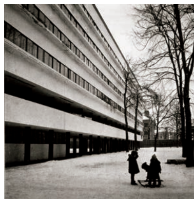
El Narkomfin de Moisei Guinzburg i Ignati Milinis, construït a Moscou (1928-1932), en una fotografia d'època.