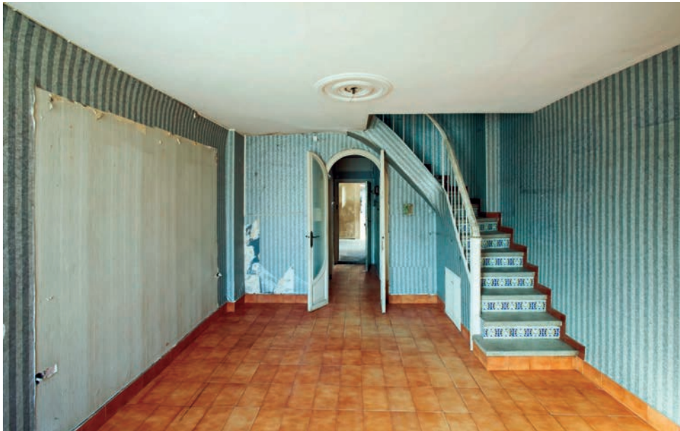
Fotografia de 2010 amb les alteracions efectuades pels estadants. El menjador amb una porta afegida que tancava el passadís d'entrada; l'escala amb les contrapetes dels graons recobertes amb rajoles i el passamà revestit de fusta.