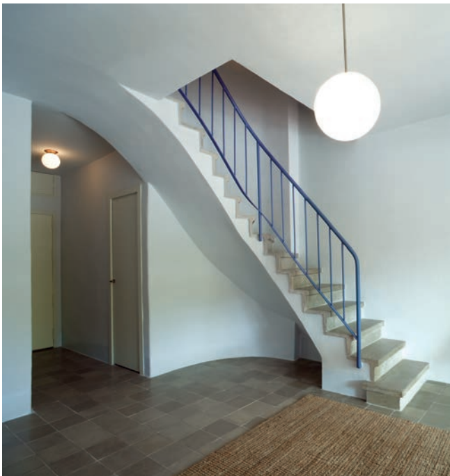
L'escala que mena al dúplex després de la restauració.