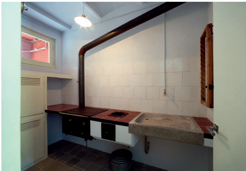
La cuina després de la restauració amb la pica, el fogó, la cuina econòmica i el rebost originals.