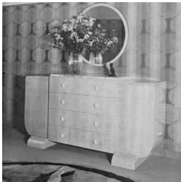
Figura 3. Calaixera de tres cossos. El central, avançat i elevat, exhibeix sobre de marbre. Descansa sobre dos travessers acabats en motllura de quart de cilindre. Mobilier et Décoration, 1928.