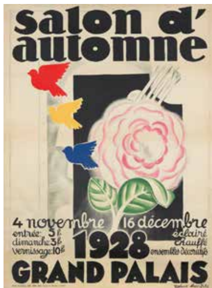
Figura 1. Cartell anunciador del Salon d'Automne de París del 1928. Obra de l'il·lustrador Robert Bonfil.