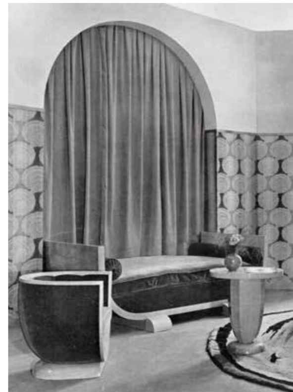
Figura 4. Un divan, una taula de centre i una de les dues butaques que formaven part de l'interior femení. Mobilier et Décoration, 1929.