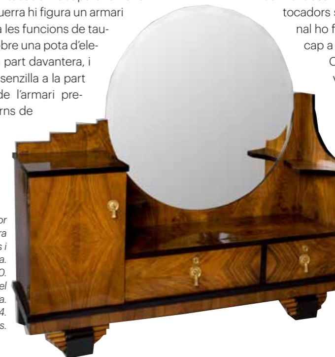
Figura 10. Tocador d'Adolf Rius i Satorra amb formes geomètriques i acabats en aplacat de noguera. Catalunya, entorn del 1930. MADB 135.405. Museu del Disseny de Barcelona. Donació d'Alicia Pascual, 1994.

de baquelita, un material nou molt característic de l'Art Déco (fig.9). Aquest armari, com bona part de la resta del moble, té un acabat en aplacat de fusta de noguera, que dona al tocador un aire més distingit i tot que el model original, de fusta clara de sicòmor més informal i desenfadat.