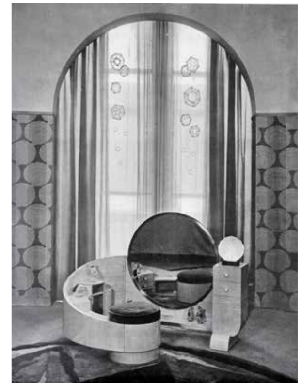
Figura 5. El tocador d'origins formes ondulants era el moble més emblemàtic i espectacular del boudoir de Sadiier et ses Fils. Mobilier et Décoration, 1929.