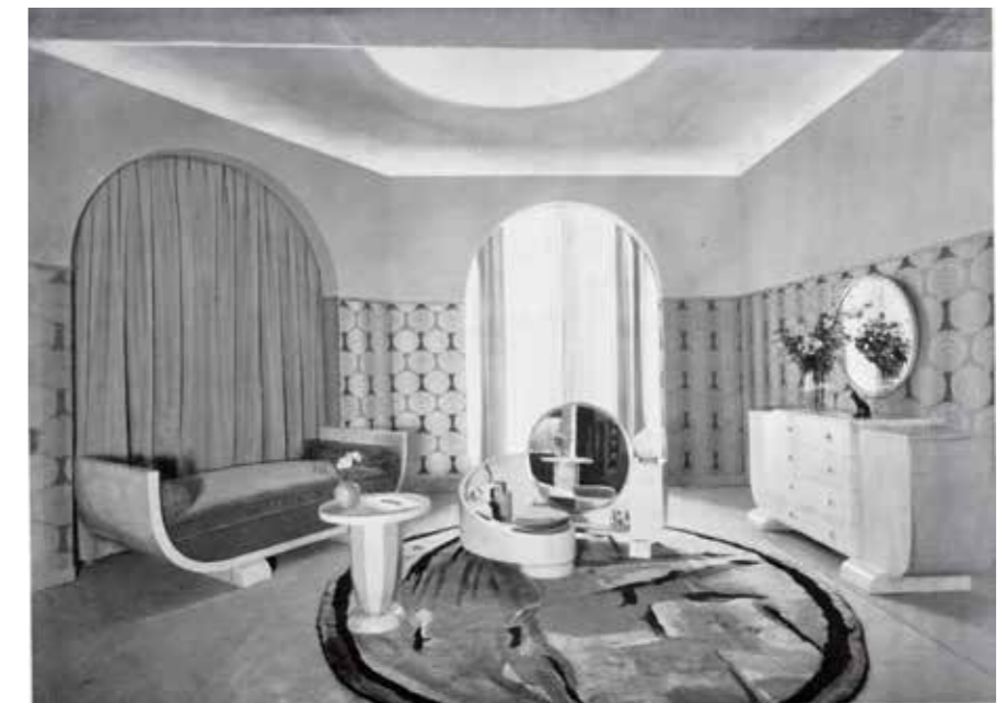
Figura 6. L'interior femení, amb mobles de sicòmor, va ser reproduït a la premsa local i internacional, fet que va donar projecció i prestigi als seus creadors. Mobilier et Décoration, 1928.

Ho podem copsar gràcies a les imatges aparegudes a la premsa de l'època. S'hi pot veure il·luminat tot el contorn superior de les parets de l'estança, on pre-