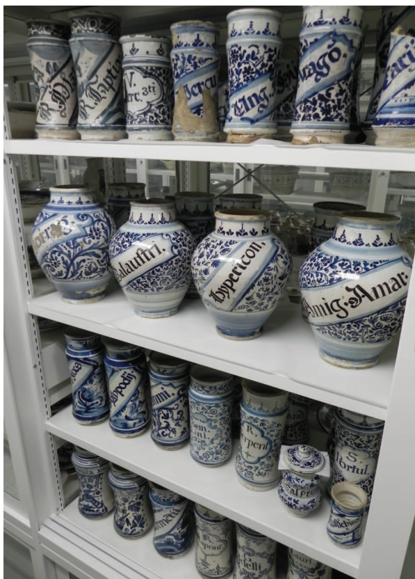
Fig. 4: Conjunt de pots de farmàcia del segle XVIII al seu espai de les reserves del Museu de Disseny de Barcelona.