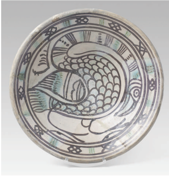
Fig. 2: L'anomenat plat del flamenc procedent dels Banys àrabs de Girona, MCB 39010. Museu del Disseny de Barcelona.

l'any 1933 als Banys àrabs de Girona i que, segons notícies del moment de la recuperació, procedeix dels nivells de la reconstrucció de l'edifici datats del 1294. Es tracta d'un plat de pisa decorat en verd i morat amb un motiu central que representa una figura d'un flamenc que ocupa tota la superfície del plat, amb el coll molt llarg que s'adapta a la forma i que té una gran vinculació decorativa amb el món àrab i bizantí. Respecte al centre productor, tradicionalment s'havia pensat en Girona però l'anàlisi arqueomètrica portat a terme sobre les peces del Museu del Disseny classificades com a gironines dona com a resultat una provenença barcelonina per a totes elles (García Iñáñez 2007: 387).