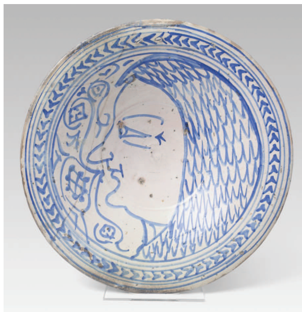
Fig. 3: Plat de la sèrie blava del segle XVI amb figura de cap de guerrer amb cota de malla, MCB 65789. Museu del Disseny de Barcelona.

Com ja hem comentat, el Museu també compta amb una nombrosa col·lecció de terrissa catalana dels segles XV-XVII procedent de les voltes de l'Hospital de la Santa Creu. Aquesta col·lecció, en l'actualitat, es troba dipositada gairebé en la seva totalitat al Museu Rocaguinarda de Terrissa dels Països Catalans d'Oristà i al Museu del Càntir d'Argentina. Tot i així, uns cent setanta exemplars estan a la seu del Museu del Disseny.