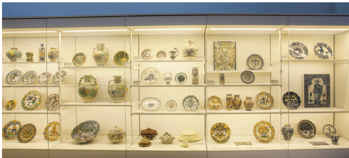
Fig. 1: Repertori de ceràmica catalana en el context internacional a l'exposició Extraordinàries, Museu del Disseny de Barcelona.

L'obra barcelonina es diferencia de la resta de produccions peninsulars pel seu repertori formal i decoratiu més aviat senzill, amb motius que ocupen tota la superfície, pel color verd oliva de l'òxid de coure, per la tonalitat rosada dels seus esmalts –degut a l'ús escàs de l'òxid d'estany i la composició de les pastes, encara amb poc contingut de calcita, que s'anirà afegint en segles posteriors (Buxeda 2011: 202)–, i pels reversos sense vidrar.