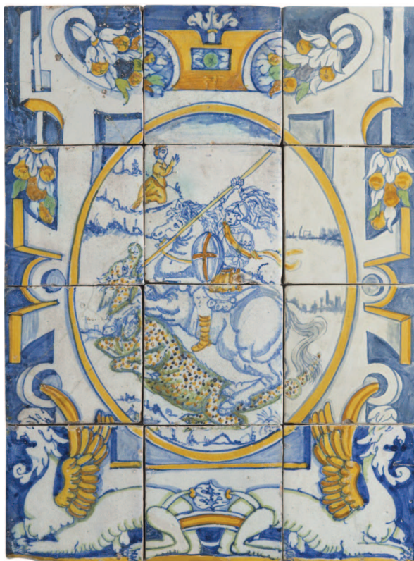
Fig. 5: Plafó de Sant Jordi encarregat a Lorenzo de Madrid l'any 1596 per a l'actual Palau de la Generalitat de Catalunya, MCB 52778. Museu del Disseny de Barcelona (©Fotografia: Guillem Fernández-Huerta).

tallers peninsulars de Talavera i Sevilla havien contractat terrissers italians i flamencs per posar al dia les seves produccions) que l'any 1596 rep l'encàrrec de fabricar les rajoles destinades a la Sala del Consistori Nou del Palau de la Diputació de Barcelona (avui palau de la Generalitat). D'aquesta sèrie, el Museu conserva com a obra destacada el plafó de sant Jordi (Fig. 5) i més de mil cinc-centes rajoles destinades als arrambadors i paviments de les sales properes al Pati dels Tarongers, que van ser recuperades l'any 1908 durant les obres realitzades per Puig i Cadafalch. D'aquestes, recentment més de tres centes han estat restituïdes a la Generalitat per tal de reintegrar-les al paviment original de la Sala dels Tarongers datat de 1603.