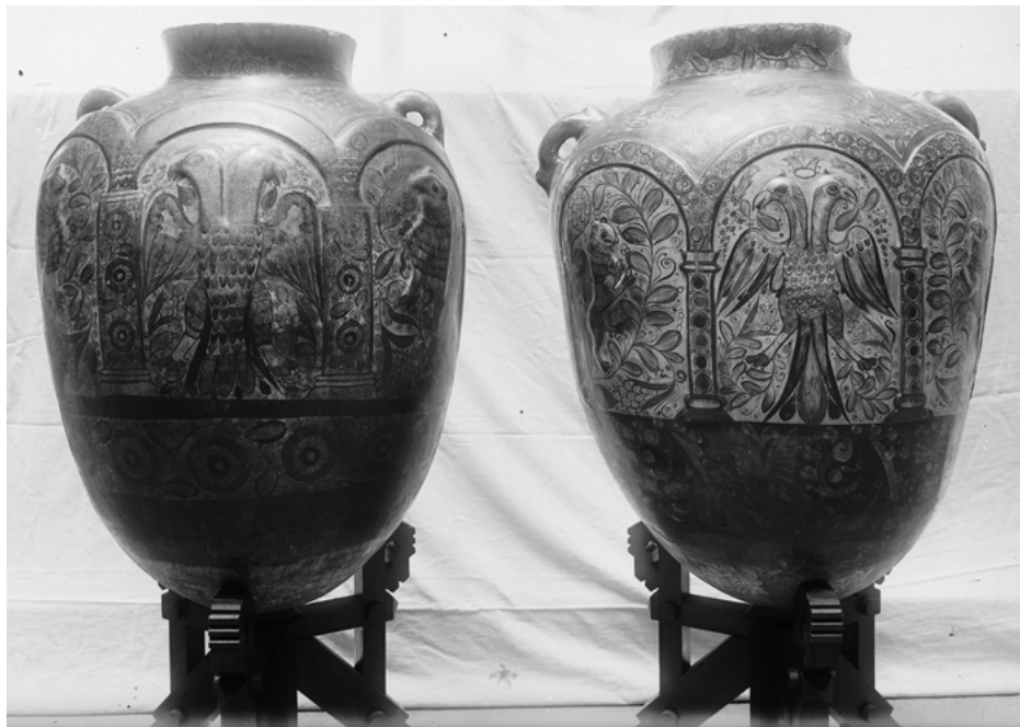
Figura 5. Gerres mexicanes d'època colonial adquirides a l'establiment F. Vidal per Joaquim de Càrcer. Museu Etnològic i de les Cultures del Món.

en què, com hem vist, va ser investit cavaller de l'hàbit de l'Orde de Santiago. (fig. 5) El noble va pagar per elles 1.500 pessetes. 31 Aquesta circumstància ens confirma l'atracció que sens dubte exercien les antiguitats en l'aristòcrata, especialment els objectes de ceràmica.