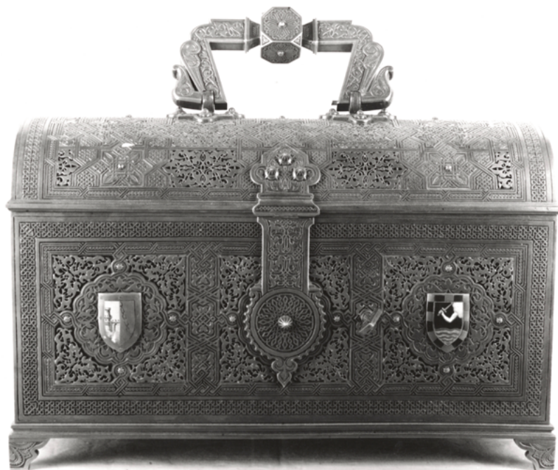
Figura 7. Cofre de plata daurada i esmalts executat al taller de la Viuda e Hijos de Francisco Cabot el 1888. Museu Nacional d'Art de Catalunya.

Els quatre canelobres van ser exhibits el 1932 al Museu de les Arts Decoratives. Actualment dos d'ells formen part de la decoració del Palauet Albéniz. 36