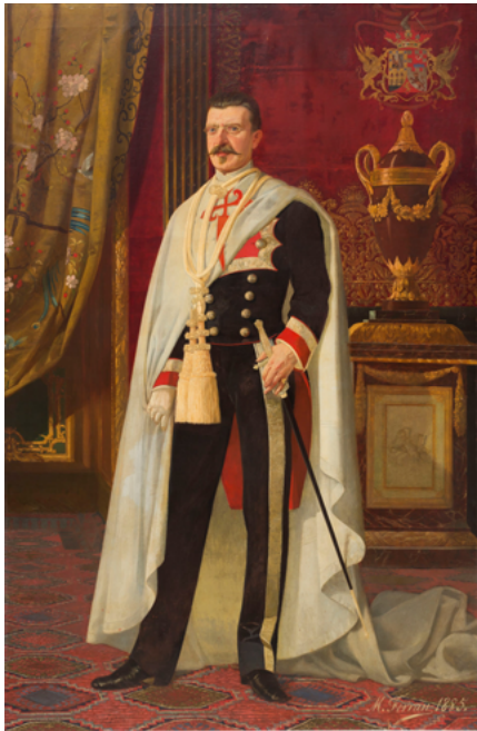
Figura 10. Joaquim de Càrcer i d'Amat, marquès de Castellbell. Obra signada per Manuel Ferran el 1885. Museu Nacional d'Art de Catalunya