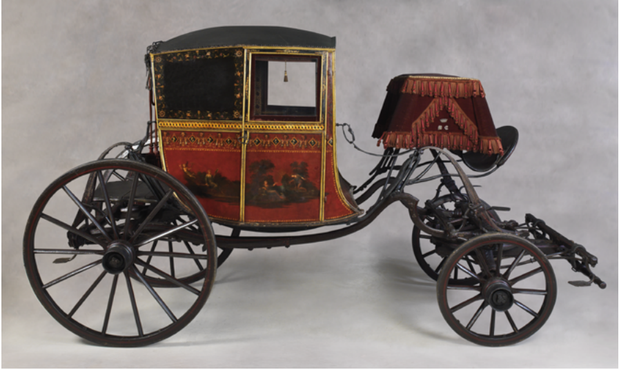
Figura 4. Berlina cupè decorada amb pintures mitològiques. Museu del Disseny de Barcelona.