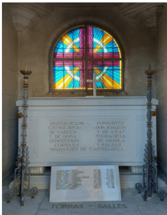
Figura 12. Panteó de Joaquim de Càrcer i la seva esposa Concepció d'Oriola-Cortada, marquesos de Castellbell, al cementiri de Sant Vicenç de Castellbell.

És significatiu també, que alhora de redactar la Memoria primera el 1913, poc després de la mort de la seva esposa, Joaquim de Càrcer i d'Amat manifesta la seva intenció de construir un panteó al poble de Castellbell on puguin ser acollides les seves restes mortals i on també siguin traslladades en un futur les despulles de la marquesa.