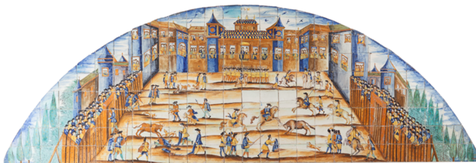
Figura 9. Plafó ceràmic La cursa de braus obrat a Barcelona el 1710. Museu del Disseny de Barcelona.

el 1885 per Manuel Ferran Bayona (1830-1896). 43 Formaven part de la decoració de la residència barcelonina dels nobles a la plaça de Santa Anna. Pel que fa al retrat del marquès, que exhibeix l'hàbit de cavaller de l'Orde de Santiago, el mateix, per cert, amb el qual va voler ser enterrat, es trobava ubicat al denominat «saló del virrei». Aquest, sens dubte, seria l'espai més emblemàtic de la mansió i s'endevina que deuria estar presidit per un retrat del virrei del Perú, Manuel d'Amat i de Junyent, l'avantpassat més universal del nostre protagonista. 44