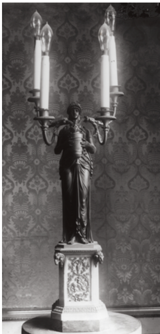
Figura 6. Canelobre d'estil imperi. El llegat estava format per quatre exemplars. Dos d'ells s'exhibeixen al Palauet Albéniz.

tònic de tres pilastres coronades per arcs de mig punt. 33 Les dues gerres es troben actualment al Museu Etnològic i de les Cultures del Món. 34