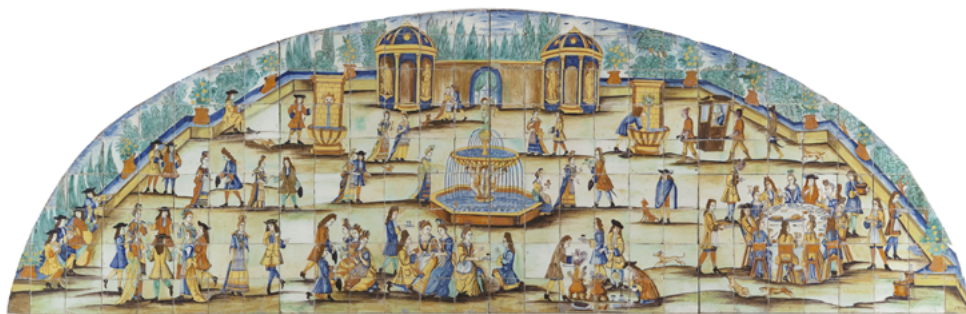
Figura 8. Plafó ceràmic La xocolatada obrat a Barcelona el 1710. Museu del Disseny de Barcelona.