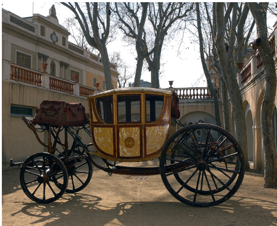
Figura 3. La berlina daurada del marquès de Castellbell al Palau Falguera.