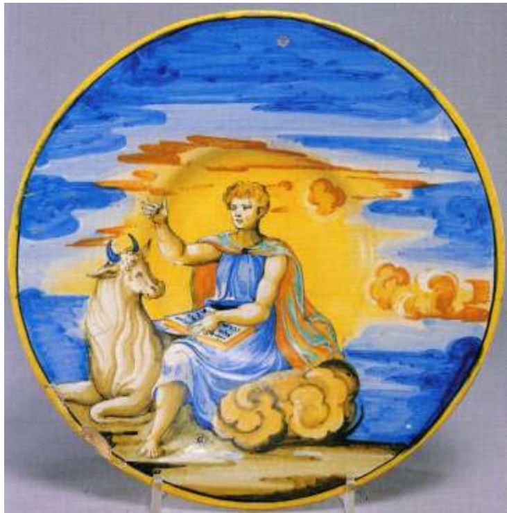
Fig. 15. Urbino, 1543. Ashmolean Museum, Oxford

Con el auge del Cristianismo el toro perdió su protagonismo en el ámbito de lo sagrado y pasó a ser el símbolo que acompaña a San Lucas, uno de los cuatro tetramorfos (evangelistas). Su imagen, que desde el siglo VI acompaña a la figura del Pantocrátor, fue descrita por primera vez por el profeta Ezequiel (siglo VI a.C) en el Antiguo Testamento. De los alfares de Urbino (Italia), que florecieron gracias al trabajo de Nicola da Urbino – apodado el ‘Rafael de la cerámica’ – salieron magníficas obras historiadas decoradas con escenas religiosas, alegóricas y mitológicas copiadas de los grabados. En el ejemplar que se publica en el presente artículo puede apreciarse que el toro ha sido relegado a ocupar un lugar secundario, pero, a pesar de ser únicamente el símbolo que acompaña a San Lucas, mantiene su empaque y su presencia con absoluta dignidad (fig. 15).