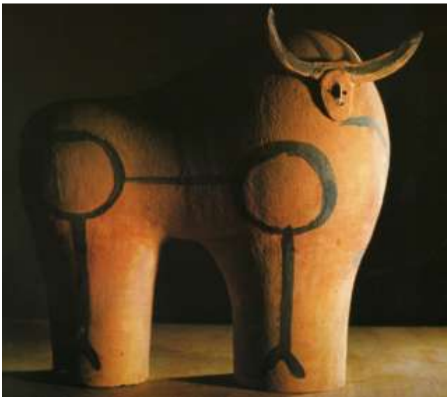
Figura 47. Picasso. Vallauris, 1947 Musée Picasso, Antibes

En la cerámica picassiana es imprescindible destacar los diferentes estilos de su propio lenguaje, arcaicos como las pinturas rupestres (fig. 47) y rápidos y esquemáticos como sus grabados (fig. 48 y 49). Pero sobre todo, es esencial destacar su capacidad de adaptar sus diseños a las caprichosas formas de las cerámicas. Por ende podría afirmarse que de algún modo, su comportamiento ante la arcilla es idéntico al de los alfareros medievales (fig. 46 a 48).