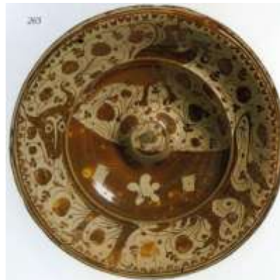
Figura 10. Manises, siglo XVII Victoria & Albert Museum, Londres

Las vajillas de loza dorada de los siglos XV y XVI fueron fabricadas por moriscos – mudéjares conversos - por encargo para los altos dignatarios de la Iglesia y para los reyes, príncipes y nobles de toda Europa, sin embargo, las cerámicas decoradas con la figura del toro, son producciones realizadas exclusivamente para una clientela española.