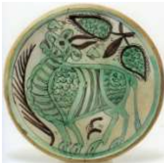
Figura 2. Paterna, siglo XIV Museo de Cerámica, Barcelona

Los servicios de mesa mudéjares decorados en verde, negro y blanco eran las vajillas de lujo de los señores feudales (fig. 2 y 3). Su ornamentación, heredera de la tradicional cerámica califal presente en los palacios cordobeses de Medina Azahara y Medina Elvira, estaba inspirada en la cerámica de Nishapur (antigua Persia). Para los omeyas, el blanco era el símbolo de su dinastía; el verde el del Islam y el negro, color que utilizaban para perfilar los dibujos, era el símbolo de Mahoma, su profeta. La figura del toro, mitificada por ellos como objeto de culto y símbolo de fuerza y solidez, se representó en muchos de los platos, escudillas y lebrillos de esta serie, en los que, como protagonista, ocupa el lugar principal.