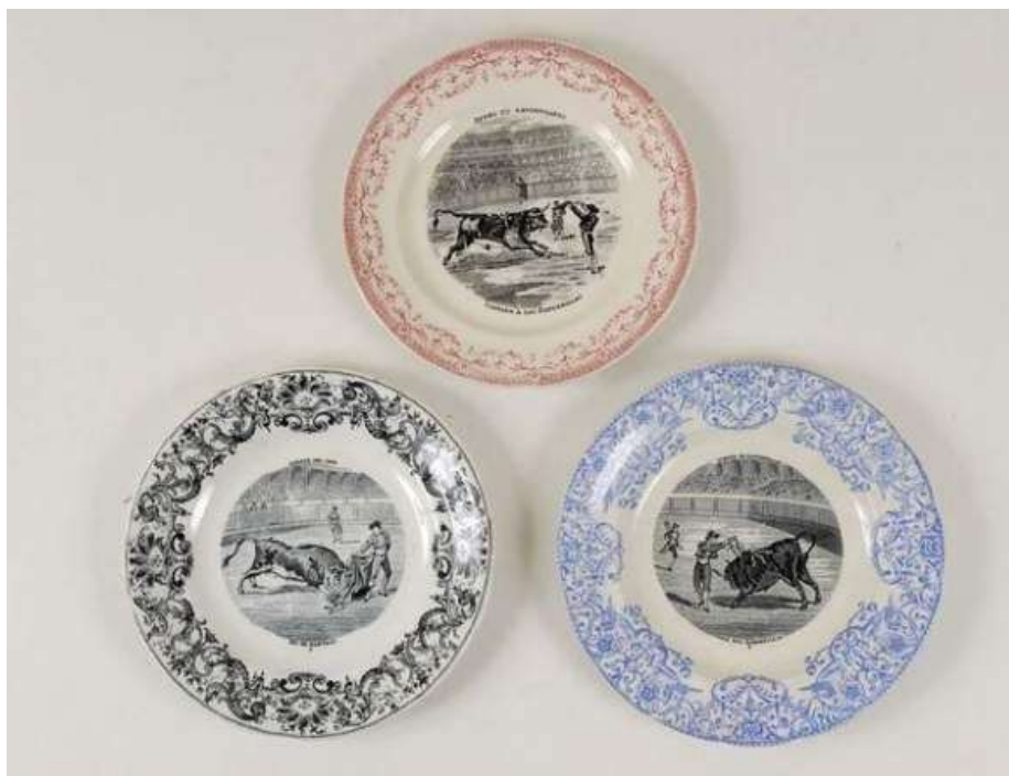
Figura 41. Gien y Fabrique de Sarreguemines, Francia, ca. 1860. Colección privada