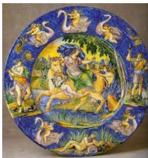
Figura 18. Nevers, siglo XVII Museo del Louvre, París

El volumen ilustrado con grabados de Michel Dorigny (1616-1665) (fig. 17) según diseños de Simon Vouet (1590-1649) fue uno de los difusores de este popular tema desde mediados del siglo XVII. 12