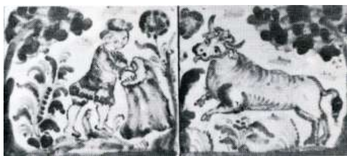
Figuras 35 y 36. Sevilla, finales del siglo XVIII Colección particular, Sevilla