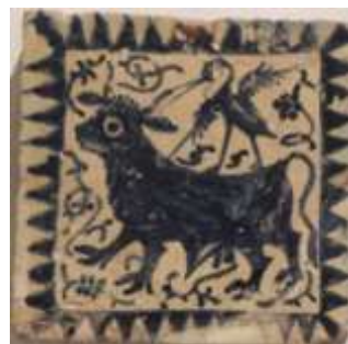
Figura 5. Manises, siglo XV Museo de Cerámica, Barcelona