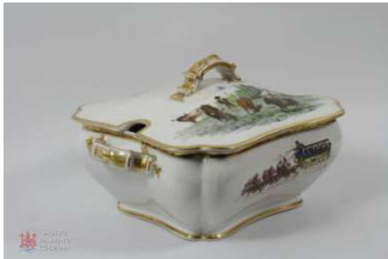
Figuras 42 a 45. Vajilla del Lagartijo. Casa Florensa. Barcelona, 1870 – 1890 Museo Taurino de Córdoba