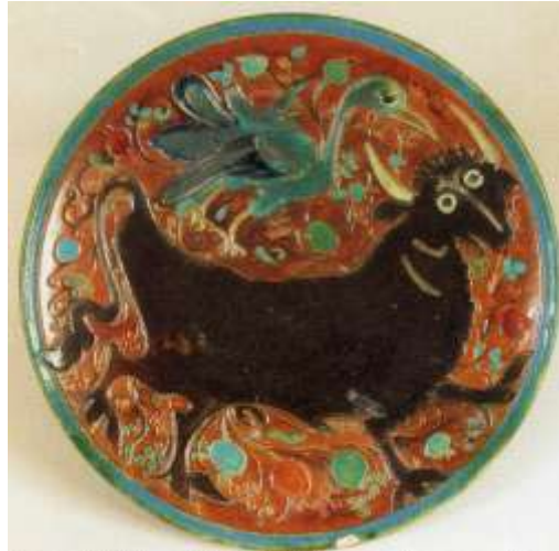
Figura 46. Talleres de los hijos de Daniel Zuloaga. Ca. 1930

Tras el triunfo y decadencia del Modernismo, movimiento artístico universal que imperó desde 1888 hasta 1910, renació el historicismo, un nuevo estilo basado en la recuperación de temas que representaban las raíces artísticas de la cultura de cada región española. Todos los centros alfareros del país, en un afán por reproducir las tradiciones medievales, repitieron las tipologías y el repertorio temático que habían triunfado cinco siglos antes (fig.46).