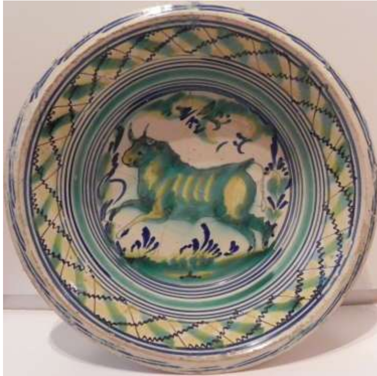
Figura 37. Sevilla, siglo XIX. Museo de Cerámica, Barcelona

Un interesante ejemplar es el gran macetero que preside la sala de las columnas del palacio ducal de los Medina Sidonia en Sanlúcar de Barrameda. Su singularidad reside en la decoración, hecha por encargo de don Pedro de Alcántara Álvarez de Toledo y Palafox, XVIII duque de Medina Sidonia (1803-1867), en memoria de su protegido, el torero apodado El Tato (Antonio Sánchez, 1831-1895). A este diestro se le recuerda por su majestuosidad y pundonor y por su graciosa forma de ejecutar el volapié. El 7 de junio de 1869, lidiando junto al Lagartijo y a Frascuelo en la plaza de las Ventas de Madrid, un toro le hirió en la pierna derecha con tan mala suerte que se le infectó y no hubo más remedio que amputársela. En el macetero, provisto de las características asas rizadas trianeras, puede apreciarse la historia de su vida, los inicios de este memorable diestro como banderillero, luego como torero y rejoneador y también su declive tras haber perdido la pierna. Por sus colores y su forma puede saberse que esta obra es de finales del siglo XIX, fecha en que empieza a utilizarse por primera vez el color rosa (fig. 38).