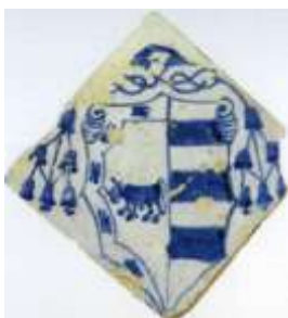
Figura 13. Escudo de los Borja. Manises, ca. 1503 Museo de Cerámica González Martí, Valencia

El toro también está presente en el escudo de algunas familias extranjeras como la de los Bull de Headington en Oxfordshire (Reino Unido). De esta familia se conservan un servicio de porcelana china de la dinastía Qianlong y un servicio de café, datados alrededor de 1750, cuyo escudo ostenta tres cabezas de toro sobre inscripción que reza: Periculo et labore (fig. 14) 11 .