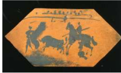
Figura 49. Picasso. Vallauris, 1957 Museo de Cerámica, Barcelona