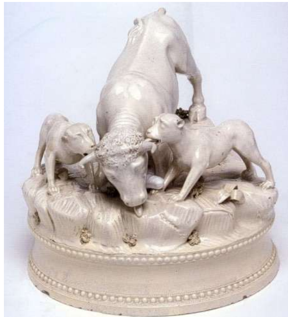
Figura 26. Perros atacando a un toro. Manufactura de Alcora, Finales del siglo XVIII Colección Torrecid, Alcora

El enfrentamiento entre perros y toros y la lucha entre animales era una diversión, un entretenimiento como aquellas venerationes que se organizaban al final del imperio romano, que acabaron convirtiéndose en espectáculos o pruebas deportivas a partir de la Edad Media. A lo largo del reinado de Isabel I de Inglaterra (1558-1603), estos espectáculos eran tan frecuentes, que ella misma dedicaba los martes a estas actividades. Cada semana acudía a ver combatir a sus mastines con los leones, toros, osos, y otros animales (fig. 26). 14