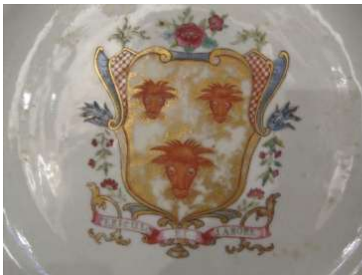
Figura 14. Escudo de la familia Bull de Oxfordshire. Ca. 1750. Colección privada

El toro también está presente en el escudo de algunas familias extranjeras como la de los Bull de Headington en Oxfordshire (Reino Unido). De esta familia se conservan un servicio de porcelana china de la dinastía Qianlong y un servicio de café, datados alrededor de 1750, cuyo escudo ostenta tres cabezas de toro sobre inscripción que reza: Periculo et labore (fig. 14) 11 .