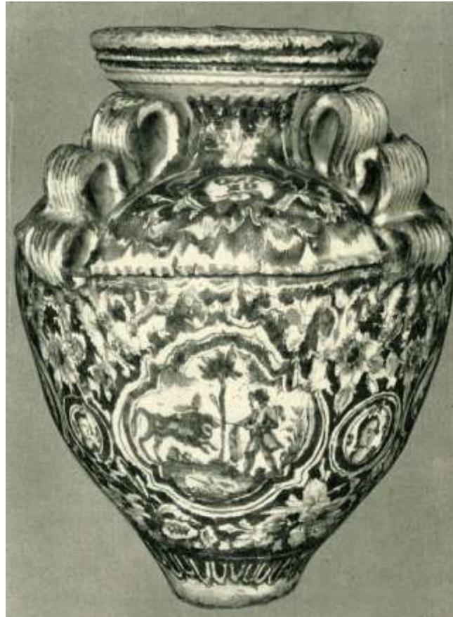
Figura 31. Sevilla. 1775. Museo Arqueológico Nacional, Madrid