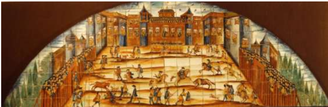
Figura 25. Barcelona, 1710. Museo de Cerámica, Barcelona

La plaza Mayor de Madrid se construyó en 1617 a imagen y semejanza de las plazas mayores iberoamericanas, la primera de las cuales fue diseñada en 1580. Estas plazas funcionaban como espacios públicos multifuncionales, y allí era donde tenían lugar mercados, paradas militares, juegos, fiestas populares, bodas, natalicios y corridas de toros. Era un centro destinado a reunir al pueblo y a la corte para en las ocasiones señaladas. En el caso de la plaza Mayor de Madrid, las edificaciones no eran residenciales sino palcos de propiedad y alquiler para la gente que quería disfrutar de las celebraciones y fiestas, siendo la taurina, la actividad preferida por la población española 13 .