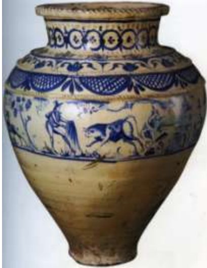
Figura 32. Sevilla, principios del siglo XIX Colección Carranza, Sevilla