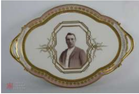
Figura 42. Casa Florensa. Barcelona, 1870-1890