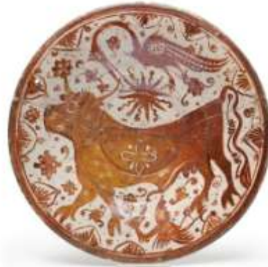
Figura 8. Valencia, siglo XVI Museo de Cerámica, Barcelona