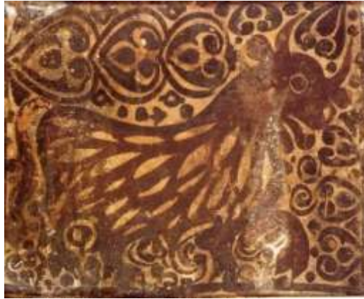
Figura 6. Paterna, siglo XV, Fundación Francisco Godia, Barcelona