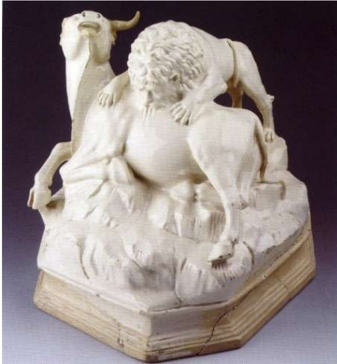
Figura 27. León devorando a toro Manufactura de Alcora, 1800 Fundación Manuel Rocamora, Barcelona

El león, símbolo del día, devorando al toro agonizante que simboliza la noche. Esta escultura forma parte de un grupo de piezas que reproducen luchas de animales modeladas en la fábrica bajo la dirección artística de Joaquín Ferrer Miñana desde finales del siglo XVIII (fig. 27).