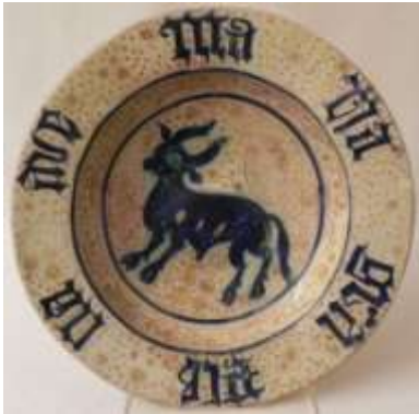
Figura 7. Paterna/Manises, siglo XV Museo de Cerámica, Barcelona

Pero por su alto nivel creativo, por su elegante refinamiento y por la complejidad y cantidad de obras que se han conservado, destacan las series de Paterna (siglo XIV a XVII) (Fig. 7) y Manises (siglo XIV a XVIII) (Fig. 8 a 10). De esta última ciudad partieron artesanos hacia Barcelona y Reus en Cataluña, hacia Muel en Aragón y hacia Sevilla en Andalucía, con el fin de difundir las técnicas.