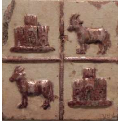
Figura 11. Escudo de la familia Boil. Manises, siglo XV. Museo de Cerámica, Barcelona

complejidad. Entre las representaciones heráldicas más habituales, todas ellas cargadas de simbología, el toro está presente en los escudos nobiliarios de algunas familias españolas como los Boil (fig. 11 y 12), los Lastra, los Gascón de Muduex y los Borja (fig. 13) y en el de Garsenda de Bearn, esposa de Guillém de Montcada (siglo XIII).