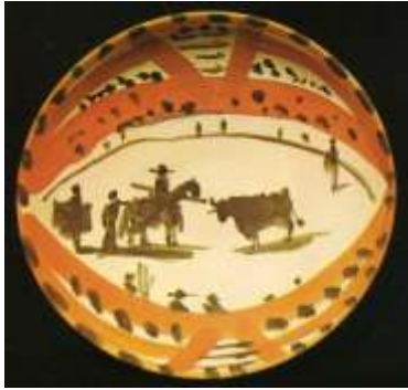
Figura 48. Picasso. Vallauris, 1953 Musée d'Art Moderne, Ceret