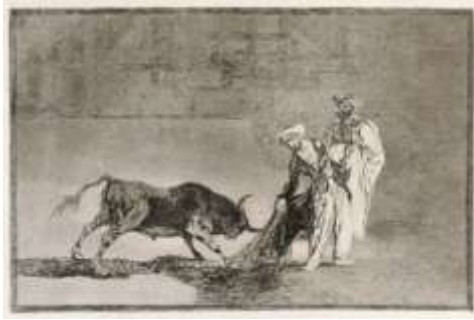
Fig. 39. Francisco de Goya y Lucientes (1746-1828) Aguatinta. 1816