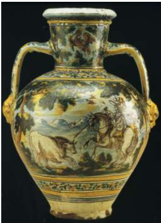
Figura 22. Talavera de la Reina/Puente del Arzobispo Finales del siglo XVII. Colección Carranza, Sevilla

Otro ejemplar curioso es la jarra vinera decorada con una escena de rejoneo en la que el caballero, en lugar de cabalgar sobre un caballo, lo hace sobre un toro (fig.23). En aquel momento, las publicaciones de temas cinegéticos eran los libros de cabecera de reyes, príncipes y nobles europeos, para quienes la posesión de animales exóticos y salvajes, era su deporte preferido.