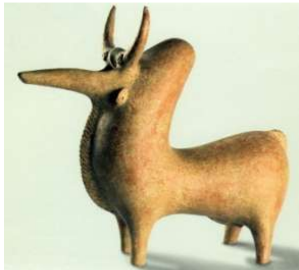
Figura 1. Irán, 1200-1100 aC Kunstmuseum. Karlsruhe, Alemania 2

Desde los tiempos más remotos, el toro, por su carácter sagrado, aparece reiteradamente en el arte y concretamente en la cerámica. Las culturas del norte de Europa y las del Mediterráneo oriental y occidental así como las indoeuropeas, veneraban a este animal bravo y difícil de domesticar, inteligente, rápido y violento, símbolo de la divinidad masculina por excelencia y regulador del ciclo de la vida (del cosmos, de la vegetación, de los animales, de los seres humanos y de los espíritus). El toro en el Paleolítico era el rey del universo y estaba vinculado a la fecundidad cósmica y terrenal, a la noche y al día y al ciclo de la vida y la muerte; en Egipto era el guardián del más allá; en Mesopotamia fue dios de la fertilidad y en Grecia, donde también se