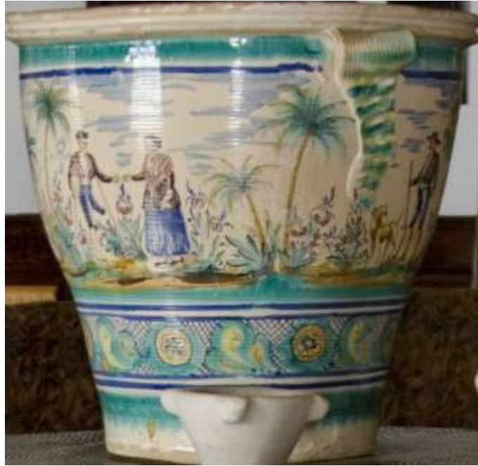
Figura 38. Sevilla. Palacio Medida Sidonia. Sanlúcar de Barrameda