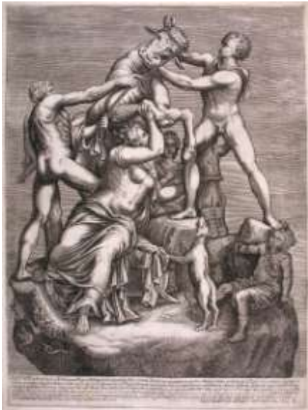
Figura 19. Grabado del siglo XVII

encargó excavar las Termas de Caracalla (Roma) y encontró esta magnífica escultura que pasó a formar parte de su colección privada en el palacio ducal de Parma. El padre de Isabel Farnesio (1692-1766) legó directamente esta gran obra a su nieto Carlos VII, (rey de Nápoles y Sicilia entre 1734-1759), patrocinador de las excavaciones de Pompeya y Herculano. Este rey ilustrado y mecenas, dejó sus colecciones en Nápoles antes de partir hacia España en 1759 para ocupar el trono de su país y por esta razón, forma parte de las colecciones italianas.