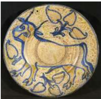
Figura 9. Manises, primer cuarto del siglo XVI Instituto Valencia de Don Juan, Madrid