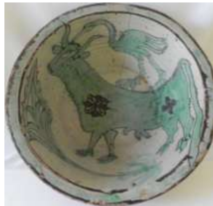
Figura 3. Teruel, siglo XV Museo de Cerámica, Barcelona

Su silueta, rodeada de motivos vegetales tales como helechos, piñas y el árbol de la vida - símbolo de la vida eterna -, se adapta a la forma cóncava de los recipientes. En reiteradas ocasiones, el toro aparece acompañado de un ave zancuda que, de pie sobre su lomo, va despiojándolo con su largo pico.