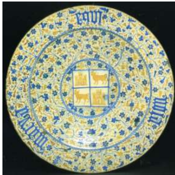
Figura 12. Manises, 1425-1455. Inscripción: marya equi noia Victoria & Albert Museum, Londres