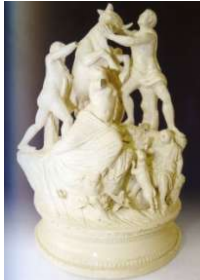
Figura 20. Manufactura de Alcora Último cuarto del siglo XVIII Museo de Cerámica, Barcelona

Los numerosos grabados que se conservan de este grupo sirvieron de modelo a los artistas del Renacimiento primero y posteriormente, a los de época neoclásica. La Manufactura de Alcora (Castellón), bajo la dirección de José Ferrer fabricó numerosas esculturas de este grupo en varias arcillas y tamaños, copiando los grabados de la época (fig. 19 y 20).