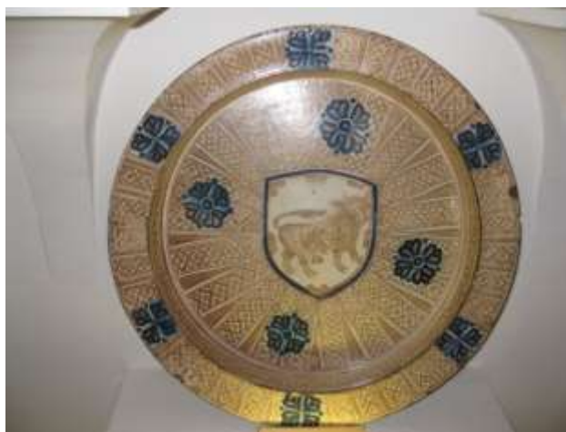
Figura 15. Manises. Siglo XV. Colección privada, Cataluña