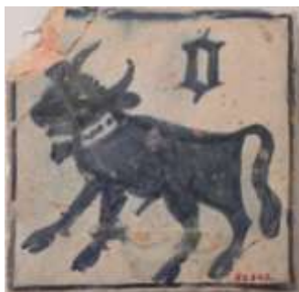
Figura 4. Manises, siglo XV Museo de Cerámica, Barcelona

5) 5 . La cerámica mudéjar decorada en azul presenta idéntico repertorio temático a su predecesora, la loza de la serie verde y morada, y por tanto, el toro era uno de los temas recurrentes para la ornamentación de los productos de esta serie.