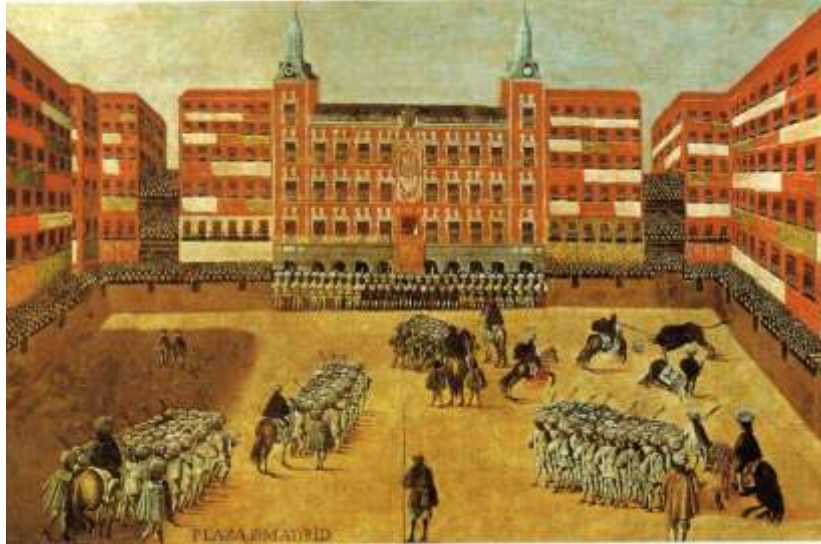
Figura 24. Escuela madrileña. Óleo sobre tela. Siglo XVII

El primitivo recinto amurallado de la Villa de Madrid encierra un importante conjunto artístico de edificios renacentistas y barrocos que configuran un escenario urbano que sirvió de inspiración a los artistas de la corte. Numerosos pintores y grabadores de la Escuela Madrileña lo inmortalizaron ya que en él es donde tenían lugar los espectáculos que se organizaban para celebrar los acontecimientos más importantes del país (fig. 24).