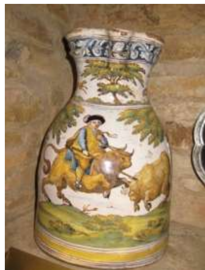
Figura 23. Jarra vinera. Talavera de la Reina/Puente del Arzobispo, siglo XVIII Colección privada, Cataluña