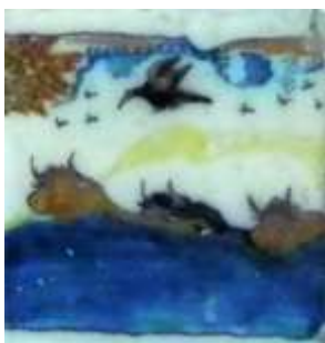
Figura 34. Sevilla, finales del siglo XVIII Museo de Cerámica, Barcelona