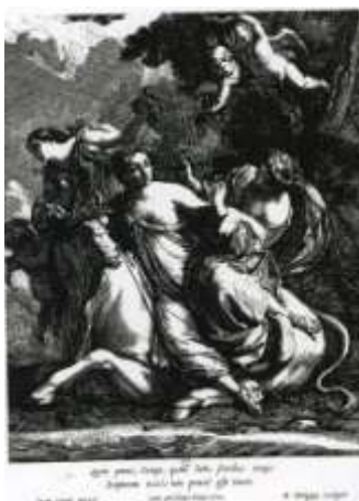
Figura 17. Grabado de Michel Dorigny Biblioteca Nacional, París

Con el triunfo del ‘gusto francés’ y de las modas procedentes de Versalles, los temas alegóricos y mitológicos también se difundieron a través de los grabados, entre diferentes centros cerámicos europeos. Uno de los asuntos preferidos por los alfareros de Nevers (Francia), - que en aquel momento recibían la influencia directa de las modas ornamentales que habían triunfado en Italia y de la vibrante policromía de sus cerámicas -, se encuentra el Rapto de Europa (fig. 18). Este tema, procedente de la mitología griega, fue ampliamente divulgado a través de las Metamorfosis de Ovidio (46 aC-17 d C), publicación que recogía la creación e historia del mundo mitológico. La escena representa a Zeus transformado en toro blanco, transportando sobre su lomo a Europa - tras haberla seducido y violado - en su viaje a nado hacia Creta.