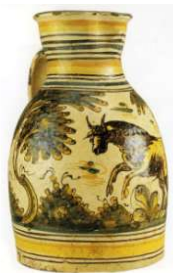
Figuras 28 y 29. Puente del Arzobispo. Siglo XVIII. Colección Carranza. Sevilla