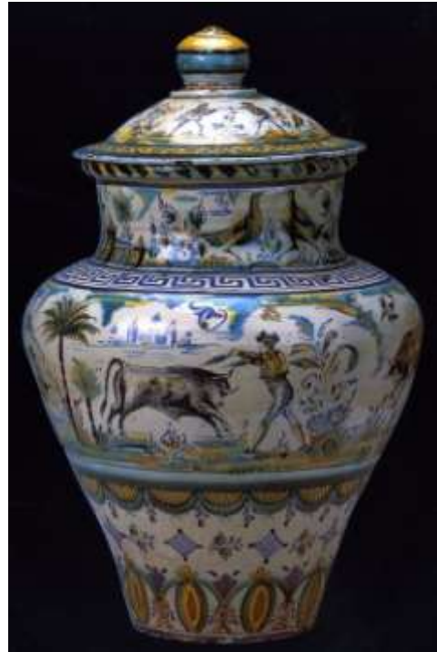
Figura 33. Sevilla, 1800-1850 Museo Victoria & Albert, Londres