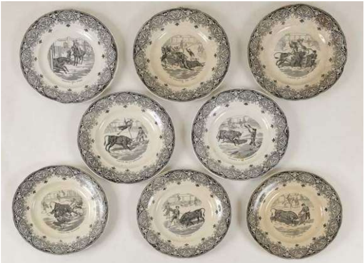
Figura 40. Creil et Montereau, Francia, ca. 1860. Tierra de pipa estampada. Colección privada