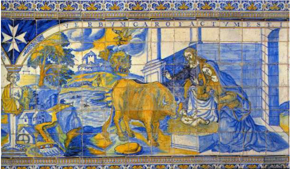
Figura 16. Talavera de la Reina. Siglo XVI Básilica de la Virgen del Prado. Talavera de la Reina

Tras lo anteriormente citado, hay que reseñar que el toro recuperó su protagonismo en el terreno de lo profano: en el espectáculo y en la heráldica. Según la crónica de la boda de Alfonso VII con Doña Berenguela, hija del conde de Barcelona - que contrajo matrimonio en Saldaña (1133)-, se sabe que la lidia de toros se había consolidado como un espectáculo social: “... entre otras funciones hubo también fiestas de toros ”. Pero la fiesta taurina no sólo tenía lugar en España sino en otros lugares de Europa. En Roma, por ejemplo, a falta de entretenimientos para los viajeros, también se organizaban espectáculos de toros, corridas conocidas como la fiesta de correr toros . Erasmo de Rotterdam (1466-1536) fue uno de los asistentes a la lidia a caballo con espada y flechas que tuvo lugar en la Plaza de San Pedro del Vaticano en 1500 10 . No es de extrañar que la figura del toro, este animal totémico, noble y fuerte, rey de la fiesta, aparezca también en la cerámica decorada, ocupando siempre el lugar más importante.