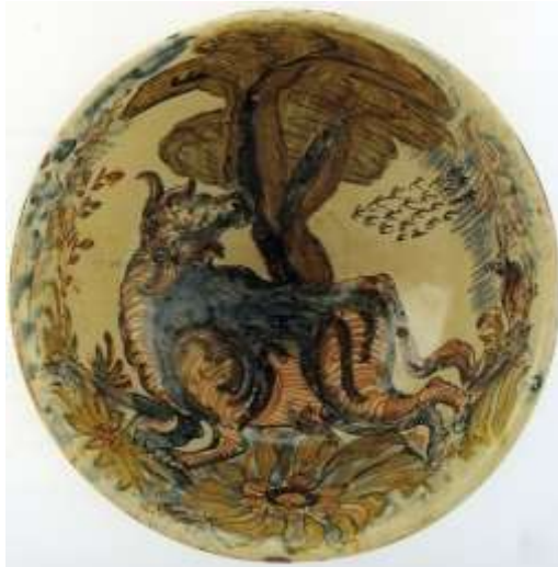
Figura. 21 Talavera de la Reina/Puente del Arzobispo. Siglo XVII. Colección Carranza, Sevilla

Otro ejemplar curioso es la jarra vinera decorada con una escena de rejoneo en la que el caballero, en lugar de cabalgar sobre un caballo, lo hace sobre un toro (fig.23). En aquel momento, las publicaciones de temas cinegéticos eran los libros de cabecera de reyes, príncipes y nobles europeos, para quienes la posesión de animales exóticos y salvajes, era su deporte preferido.