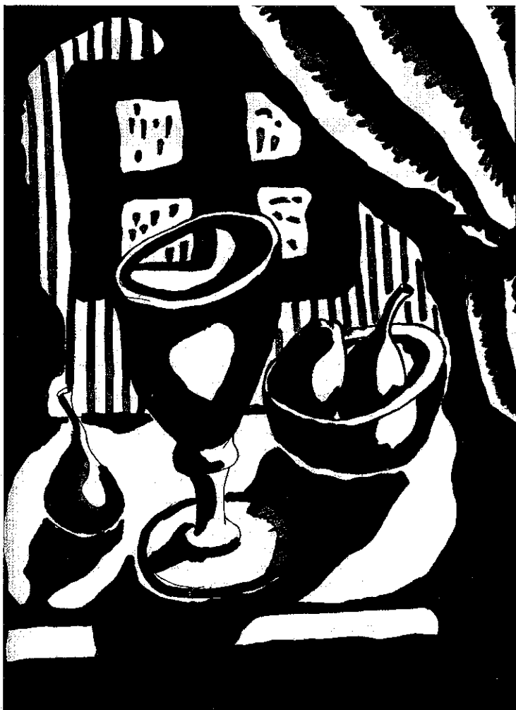
Algol , revista cultural d'avantguarda, de la qual només se'n publicà un número a Barcelona el 1947.