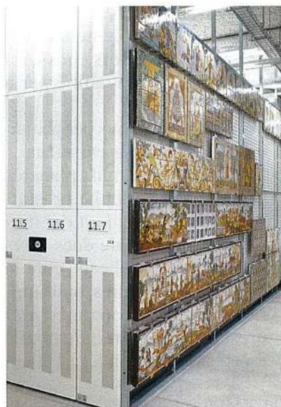
Figura 4: Contenidor 11 amb reixa a l'exterior.

12, 13, 14, 15, 16 i 17. Mòduls equipats amb els elements següents: