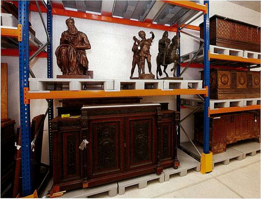
Figura 5: Estructura per a paletitzat.