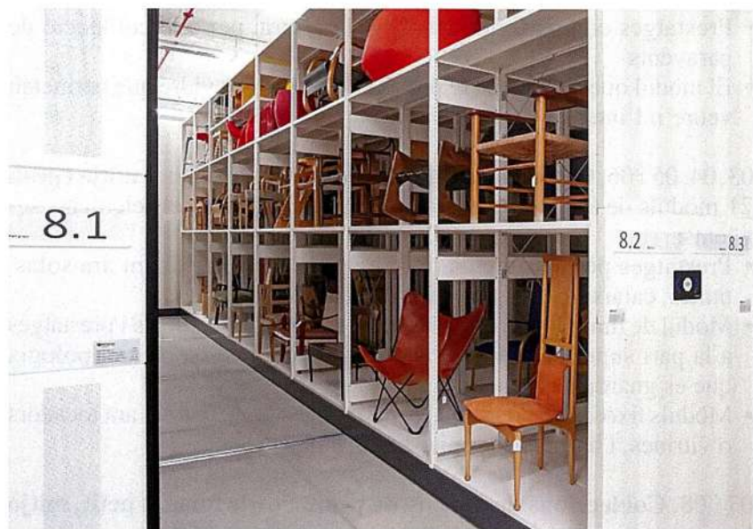
Figura 2: Contenedors compactes.

de dimensions petites (màxim DIN A4) o packaging . També s'hi instal·len, en contenidors de polipropilè estandarditzats, tipografies, etc.