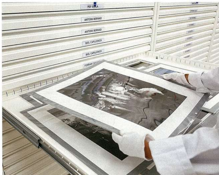
Figura 6: Planeres amb col·lecció de fotografia de moda.