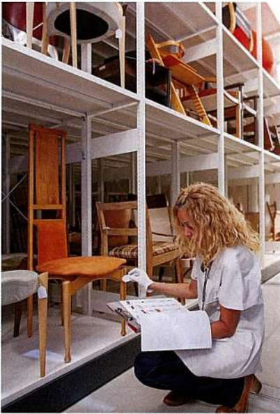
Figura 3: Contenedor 8, col·lecció de disseny de producte.