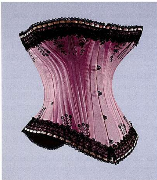
Figura 2: Maniquí de paper encolat per sostenir una cotilla del segle XIX.

El suport aguanta la part del cos en contacte directe amb la peça, però es presenta buit a l'interior, com una segona pell. Una ànima de fusta o metall li dóna rigidesa i proporciona una àrea on subjectar la tija, que, alhora, s'ancora a la paret de la vitrina. L'encert d'aquestes peces, modelades d'una en una, és el resultat del llarg treball previ de la seva creadora, que ha dedicat dècades a l'estudi de l'evolució de la silueta i a la confecció de maniquins ("Bodyteca històrica", Carmen Lucini).