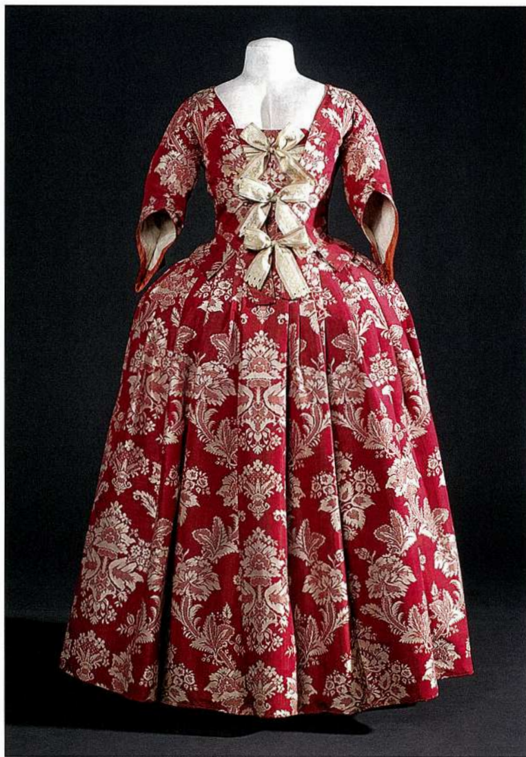
Figura 1: Maniquí històric modelat per mostrar un vestit del segle XVIII.